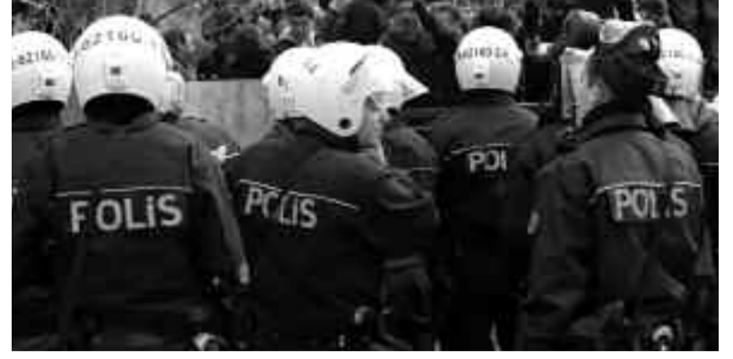
Hrant Dink'in ölümünde sorumluluğu olanlar da Gezi direnişi günlerinde insanları öldüren polisler de tutuklanmalıdır.

Polislerin tutuklanma nedeni "devlet güvenliği açısından önem arz eden, gizli kalması gereken ve temin edilmesiyle siyasal ve askeri casusluk suçunu oluşturan dinleme verileriyle ilgili içeriklerde imzalarının bulunduğu ve delilleri