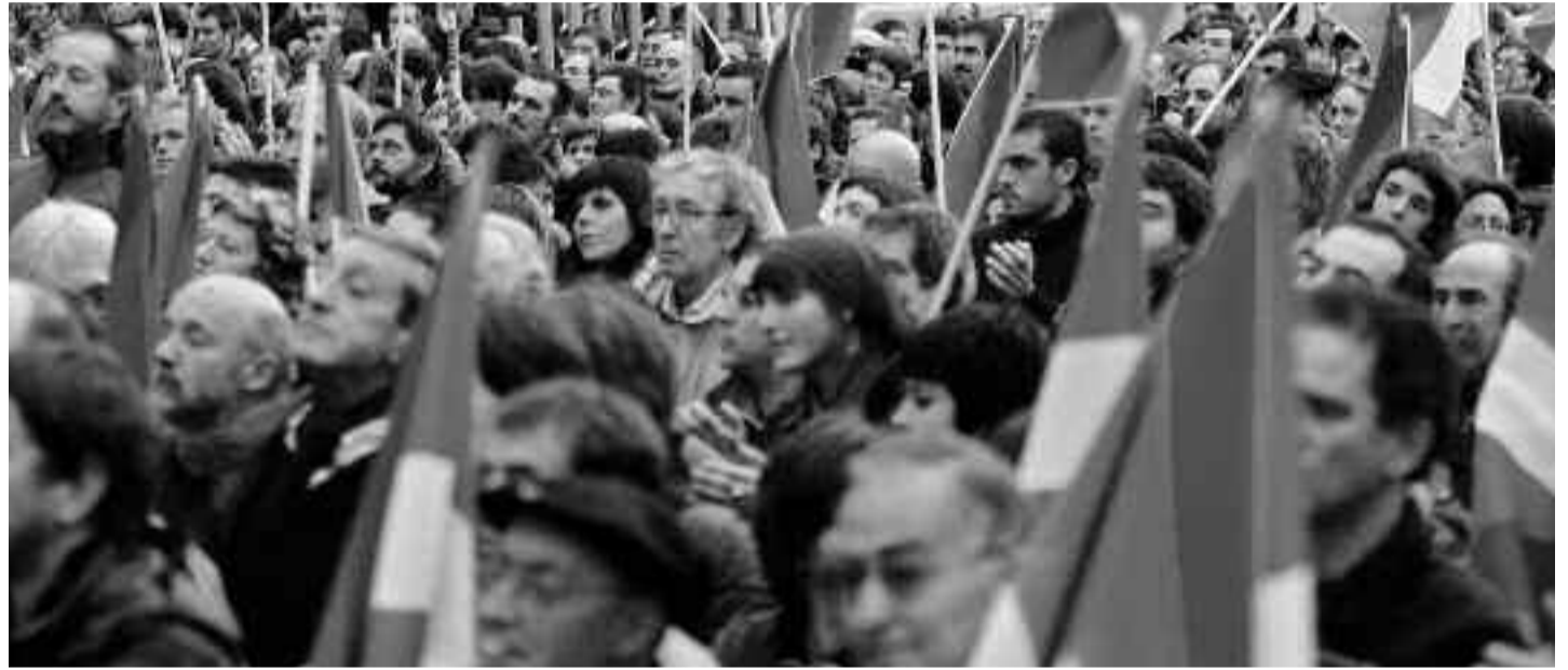
Başka bir ulusu ezen bir ulus özgür olamaz.

Bu süreç farklı uluslar arasında ezme – ezilme ilişkisinin ortaya çıkışını da beraberinde getirir. Bu ezme – ezilme ilişkisi güvence altına alınacak bir sermayesi ve dolayısıyla üzerinde egemenlik kurma ihtiyacı duyduğu bir vatani olmayan işçi sınıfını, ezilenleri ve onların mücadelesini