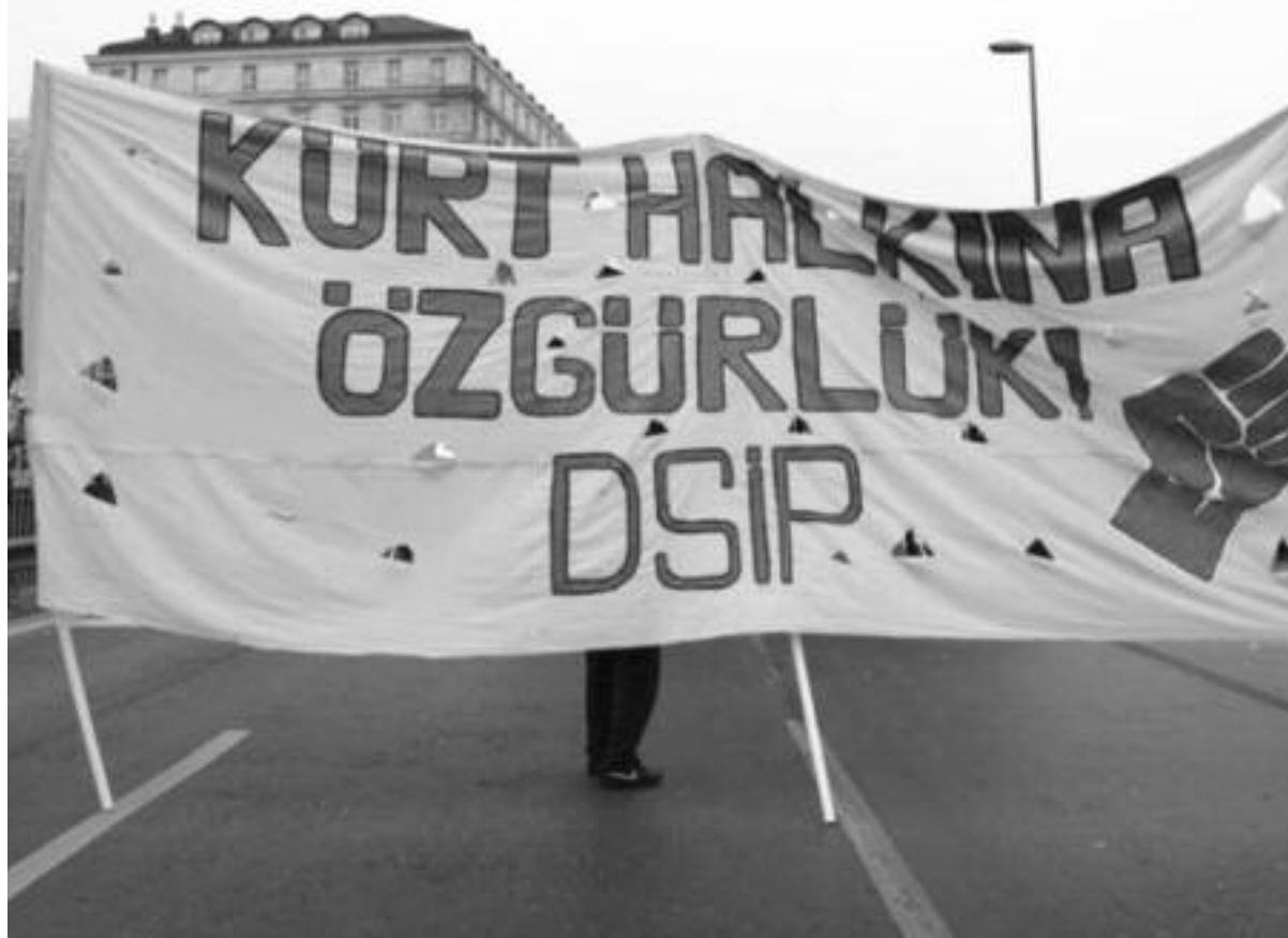
1 Mayıs 2011, Taksim.

Sosyalist İşçi tüm bunları yaparken, ulusal eşitsizliği ortadan kaldırmanın yanı sıra, Batı'daki emekçileri Türk egemen sınıfına bağlayan Türk milliyetçiliğinin geriletilmesi için mücadele ediyordu. İşçi sınıfının kendi çıkarları için bağımsız bir siyasi hareket inşa edebilmesinin yolu, emekçilerin saflarında milliyetçi fikirlerin mağlup edilmesinden geçiyor.