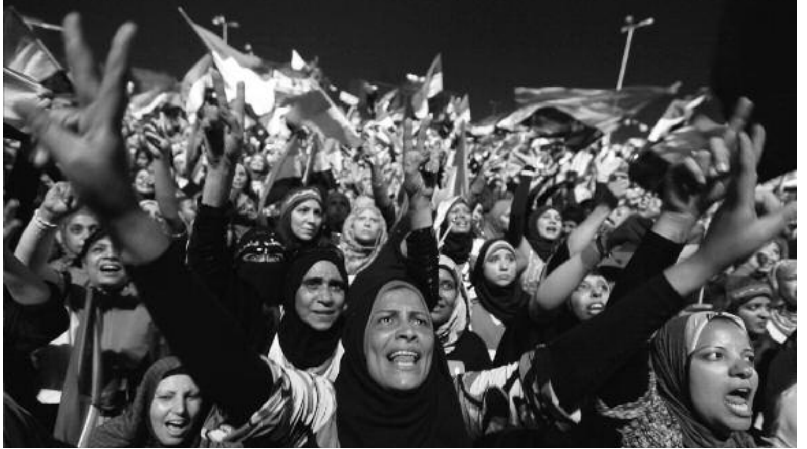
Tunus'un ardından 2011'de Mısır'da gerçekleşen devrim, Ortadoğu'dan Kuzey Afrika'ya rejimleri ve emperyalizmin hegemonyasını sarsarken dünyanın geri kalanındaki mücadelelere ilham kaynağı oldu.

Sosyalist İşçi, ilk gününden itibaren Arap halklarının mücadelesinden yana tutum aldı. İlk olarak, 11 Ocak 2011'de yayımlanan 405. sayısının dünya haberleri sayfasında Tunus ve Cezayir'de olup bitenleri "Yoksullar ayaklandı" diye duyurdu. 406. sayının manşeti ise "Özgürlük isteyenler kazandı! Tunus ayaklandı, diktatör kaçtı" idi. Bundan sonraki iki ay boyunca, Sosyalist İşçi sayfalarının çoğunluğu bölgedeki isyanlara, onların derslerine, devrime tanıklık