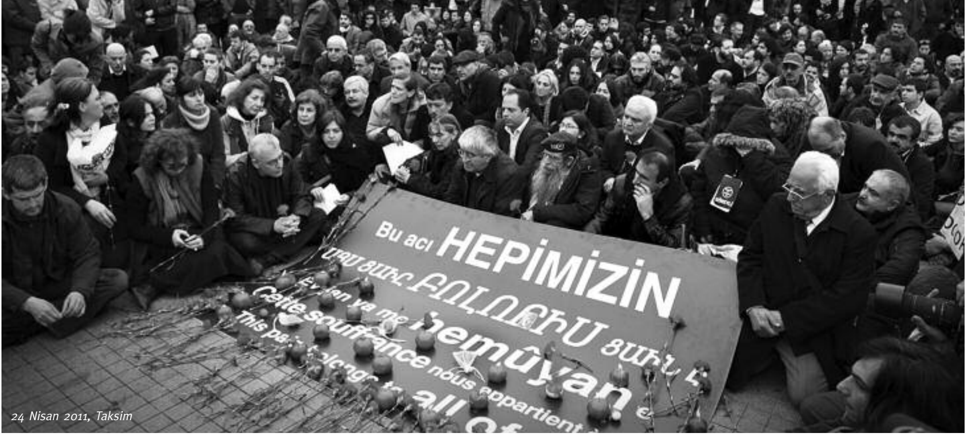
24 Nisan 2011, Taksim