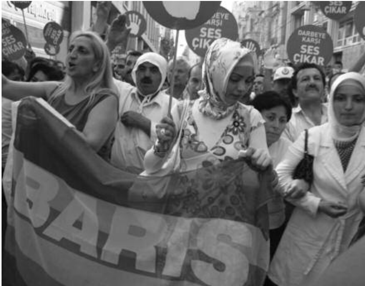
21 Haziran 2011, İstanbul İstiklal Caddesi'nde 10 bin kişinin katıldığı, gerçekleşmekte olan bir darbeye karşı ilk yürüyüş.

Siyasal demokrasinin daraltılması yönündeki müdahale,