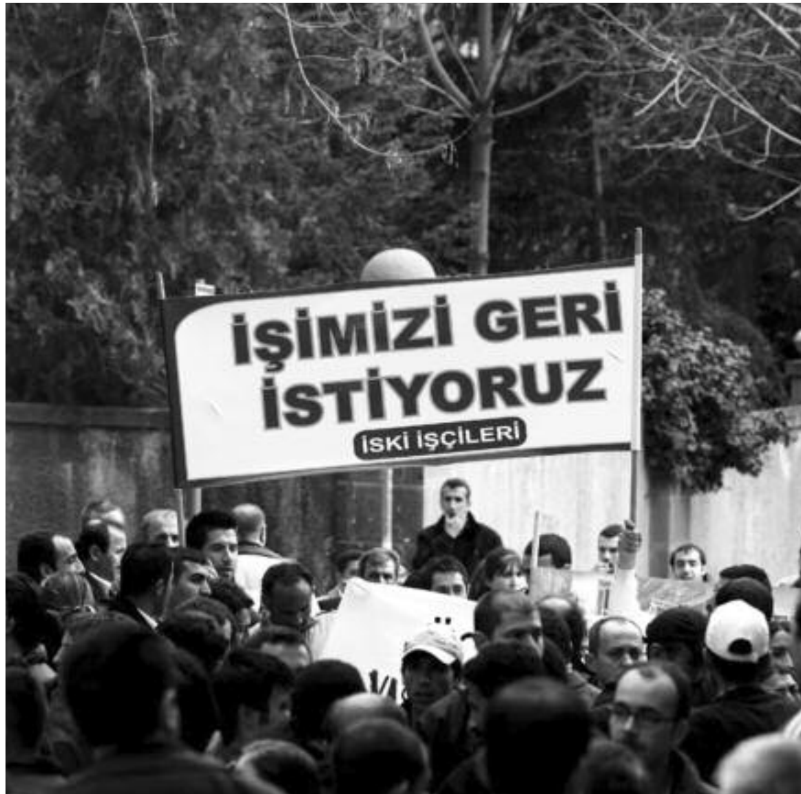
Sosyalist İşçi, fabrikalardan, işyerlerinden mücadele haberlerine sayfalarında yer vererek işçilerin birleşmesine yardımcı olmaya çalışır ve hareketin genel taleplerini savunur.

geniş bir düzeyde beyaz yakalıların işçi sınıfının parçası olup olmadığı tartışmasıydı. Sosyalist İşçi, beyaz yakalıların işçi olduğunu savundu. 1994 yılında yayımlanan başyazılardan birinin başlığı şuydu: "İşçiyiz, memuruz, sözleşmeliyiz, tek sendika altında birleşmeliyiz!"