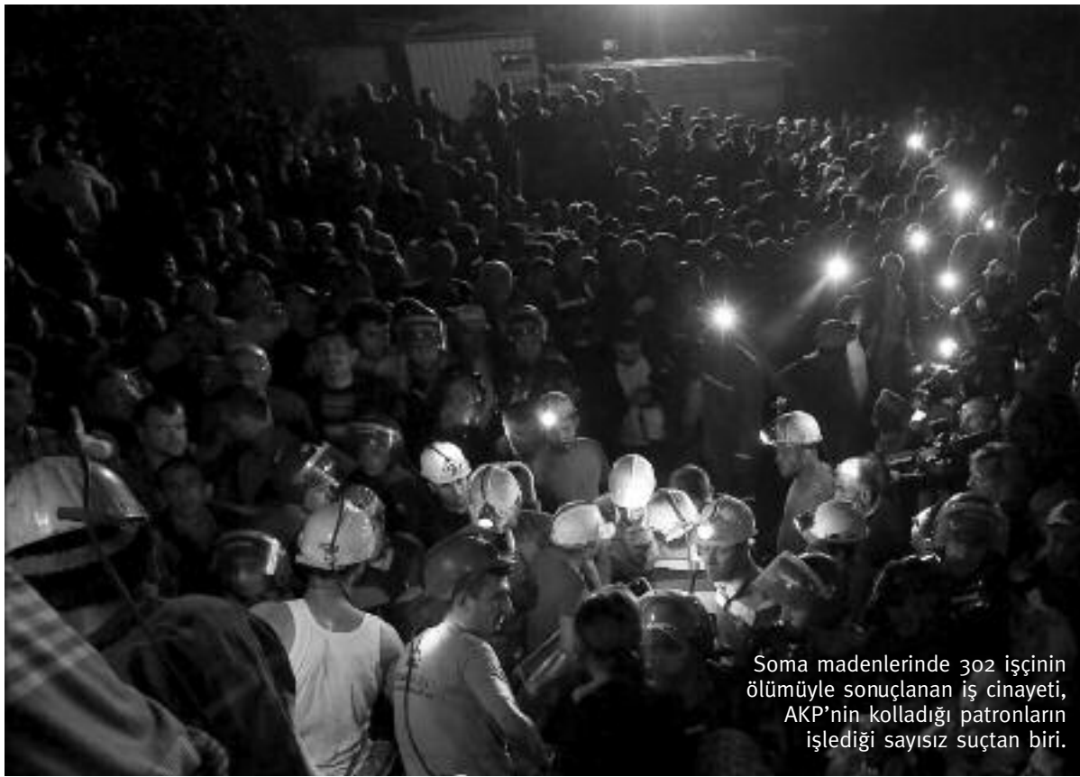
Soma madenlerinde 302 işçinin ölümüyle sonuçlanan iş cinayeti, AKP'nin kolladığı patronların işlediği sayısız suçtan biri.

Ordunun 28 Şubat darbesi milliyetçiliği yükseltti, bu milliyetçilik ise DSP-MHP- ANAP koalisyonunu üretti. Koalisyon, işçi ve emekçilere eşi benzeri görülmemiş bir ekonomik saldırı başlattı. Milliyetçi hava, idam tamamlarıyla, F tipi katliamlarla, Mezarda Emeklilik Yasası'yla, 17 Ağustos depremiyle ve en önemlisi Şubat ekonomik kri-