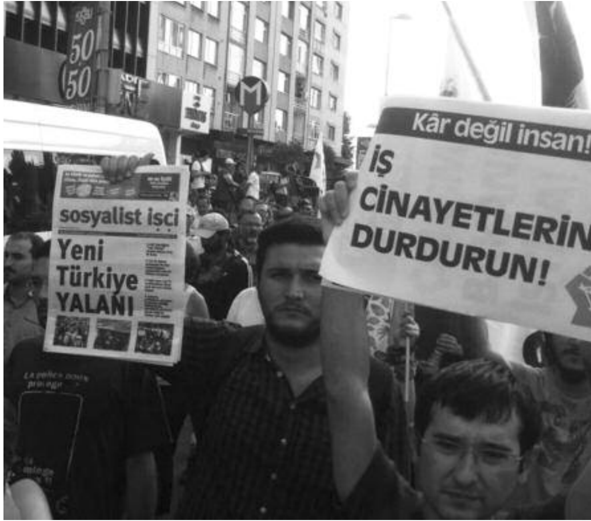
10 işçinin öldüğü iş cinayeti ertesi günü Torunlar İnşaat'a yürüyüş, 8 Eylül 2014 Mecidiyeköy-İstanbul

500 sayı boyunca, ezilenlerin sesi, kürsüsü, mücadelesinin yankısı olan Sosyalist İşçi başka bir basit kurala daha sahip: Sosyalist İşçi milliyetçiliğe en küçük bir prim vermeyen çok az yayın organından birisidir. Gazetenin sayfalarında Marx ve Engels'in şu türden cümlelerine defalarca tanık olundu: "Bütün ülkelerin proleterlerinin çıkarları