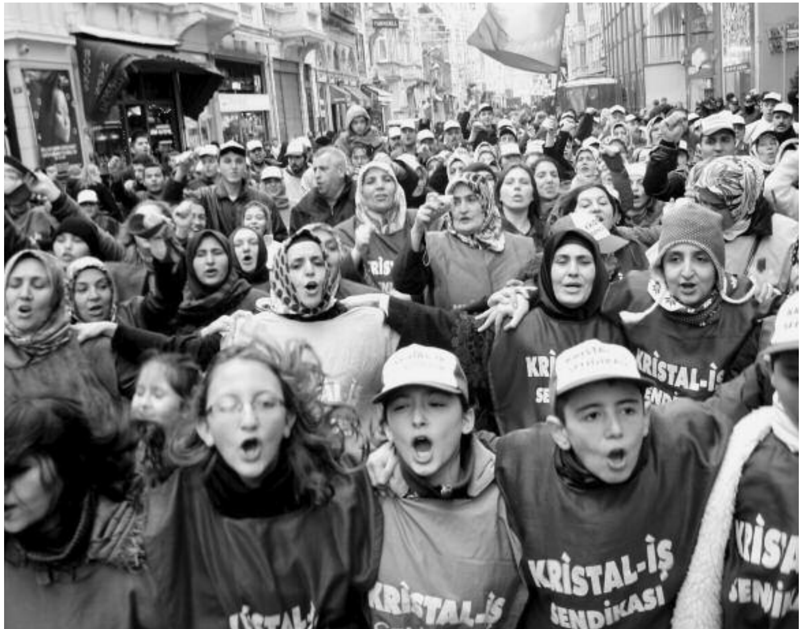
Hükümet tarafından yasaklanan grev sırasında Beyoğlu’nda yürüten Şişe Cam işçileri, 2014.