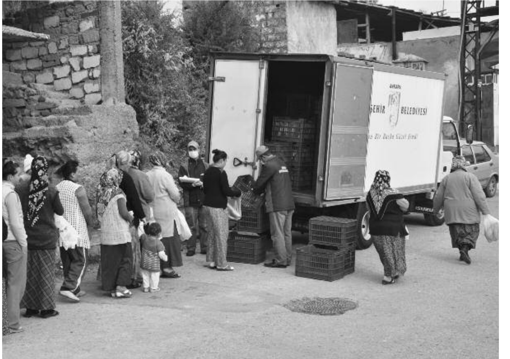
Yoksulluğun kaynağı kapitalizmdir. Yoksulluğu ortadan kaldırmak için kapitalizmi ortadan kaldırmak gerekir.

Türk İş'in yaptığı araştırmaya göre dört kişilik ailenin açlık sınırı 1190 lira. Yani sadece