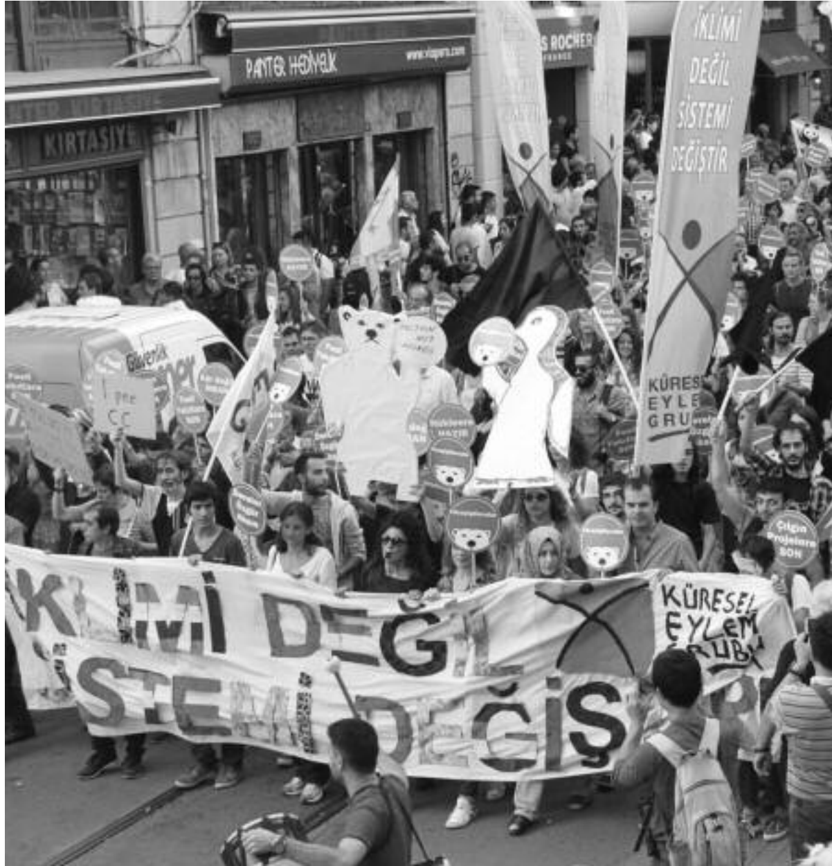
İstanbul'dan Halkların İklim Yürüyüşü, 20 Eylül 2014.

nedeni fosil yakıtların (petrol, kömür, doğalgaz) kullanımı. Fosil yakıtlar yerine rüzgar, güneş, dalga enerjisi ile insanlık enerji ihtiyacını karşılayabilir. Bu enerjileri hayata geçirebilecek teknolojik gelişime sahibiz. Enerjiyi verimli kullanmak adına atılabilecek onlarca adım var. Evlerin ısı yalıtımından tutun da, su ısıtma amaçlı sistemlerin çatılara döşenmesi, tüm alanlarda led ampullerin kullanılması... Ulaşım alanında toplu taşımacılığın ve bisikletin birincil konuma yükseltilmesi bir başka önemli adım. Tüm bu adımlar ve daha fazlası, hızla ve büyük ölçeklerde yapılması durumunda emisyon oranları radikal bir biçimde düşer. Bu adım aynı zamanda milyonlarca insan için yeni iş alanı demektir. Piyasa koşullarının elvermesini beklemeden kamusal kaynaklarla kolektif çözümler üretebilir, tek bir ülke sınırları içinde değil tüm