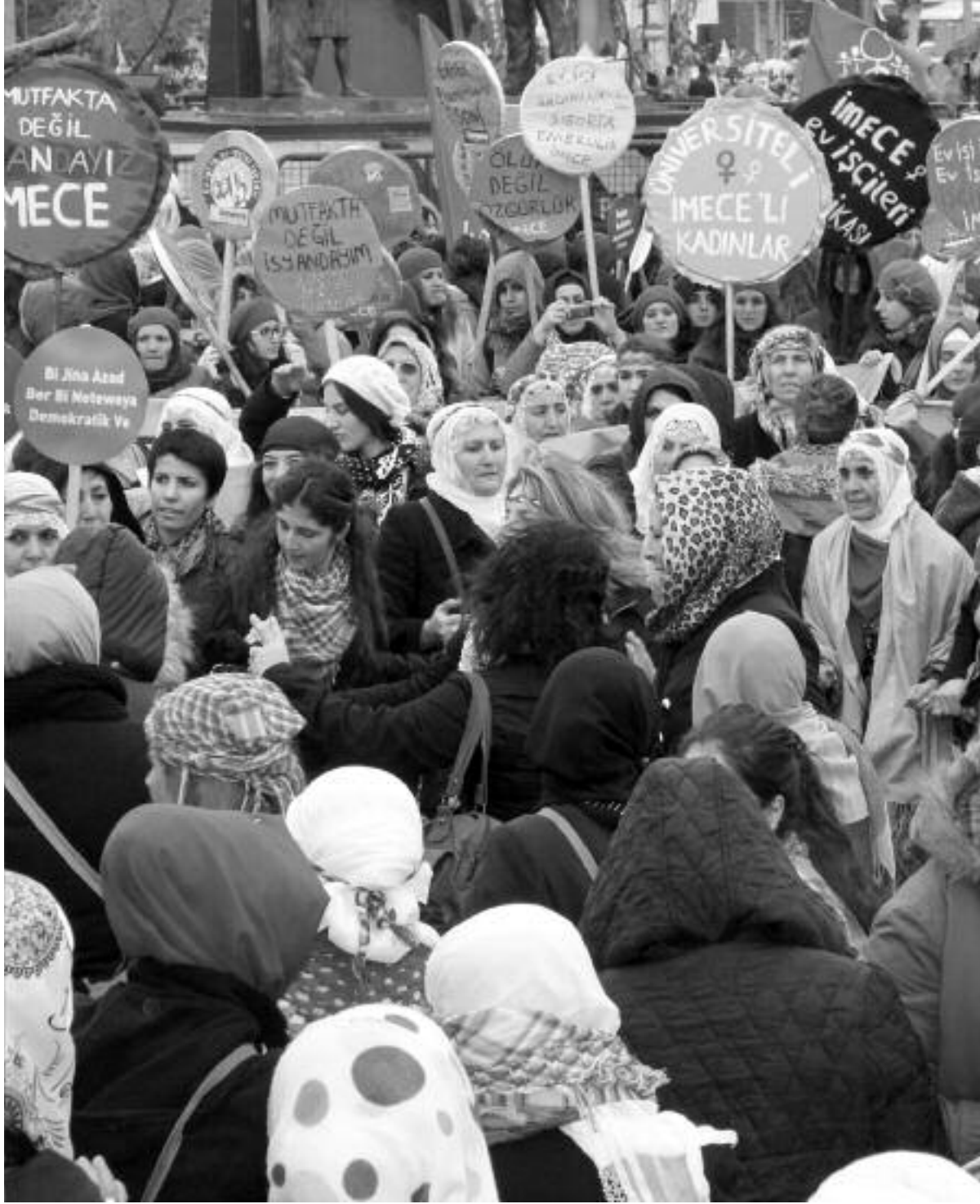
Devrimci sosyalistlere göre nasıl ezen-ezilen ulus ayrımı oldukça sosyalizm olamaz ise, kadınların kurtuluşu olmadan da sosyalizm olamaz.

Stalinist politikaları örnek göstererek sosyalistlerin kadın sorununu ertelediğini öne süren tezlerin aksine devrimci marksistler, kadınların kurtuluşunu sosyalizmin ve devrimci mücadelenin temel bir sorunu olarak görür ve ertelemez.