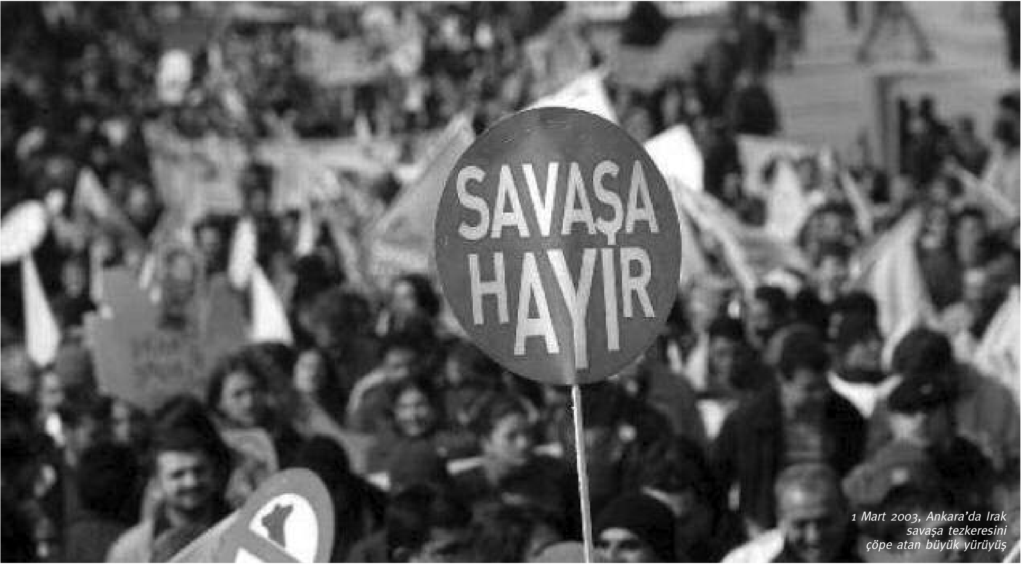
1 Mart 2003, Ankara'da Irak savaşa tezkeresini çöpe atan büyük yürüyüş