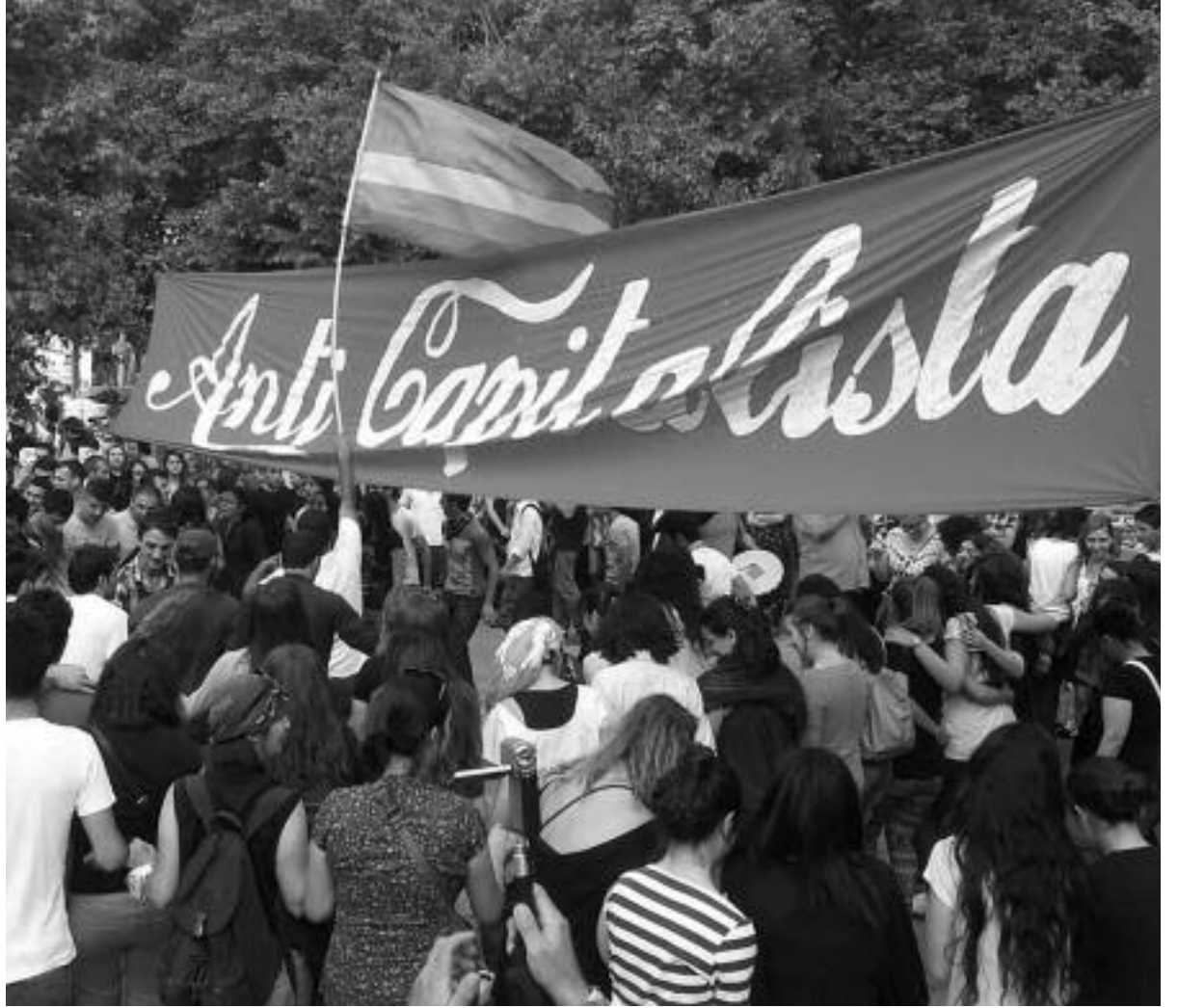
Bu sayfadaki yazılar Gezi direnişi sırasında yazılmış, Sosyalist İşçi'nin 7 Haziran 2013'te yayınlanan 467. sayısında yer aldı ve parkta dağıtıldı.

Şimdi, hem hareketin taleplerini kazanması için hem de bu hareketten milliyetçi özlemleriyle cuntaya davetiye çıkartmaya çalışanları geriletmek için mücadeleye devam edeceğiz. Erdoğan'ı da gerileteceğiz, milliyetçileri de. Neo liberal kibri de yeneceğiz darbe severliği de.