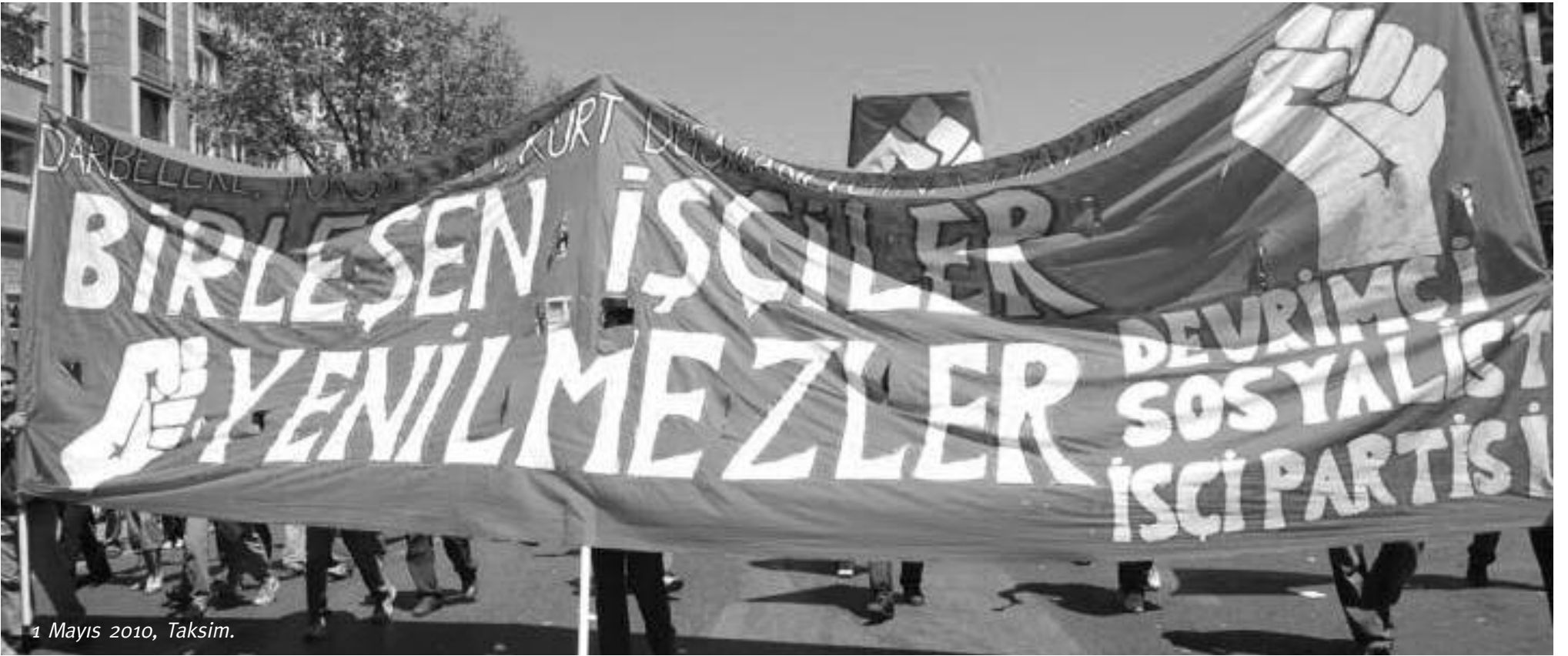
1 Mayıs 2010, Taksim.