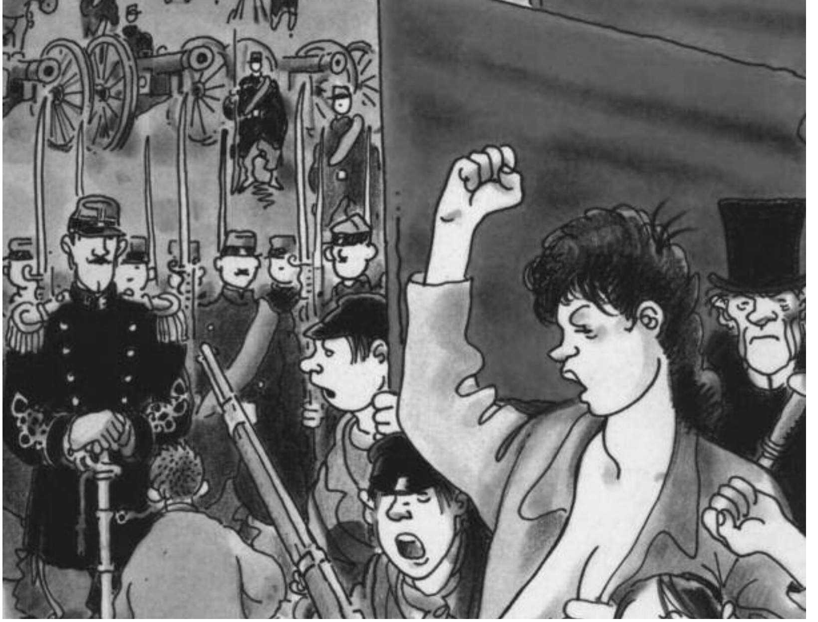
Paris Komünü, 1871. Aşağıdan sosyalizm bir partinin iktidarı değil işçilerin ve fakirlerin kendi doğrudan demokrasi organlarının iktidarındır.

ABD'de ortaya çıkan antikapitalist hareketi, aşağıdan yükselen yeni bir mücadele dalgası olarak selamladı. Kendisini sosyalizm olarak ortaya koyan stalinist devletlerin art arda yıkılmasıyla birlikte, kapitalizmin teorisyenleri tarihin sonuna geldiği ve kapitalizmin evrensel zaferini ilan ediyordu. Bütün dünyada işçi sınıfının mücadelesinde genel bir geri çekilme yaşandı, neoliberalizm yükseldi. Ancak kapitalizmin bu sözde evrensel zaferi sadece 10 yıl sürdü. 1999'da ABD'nin Seattle şehrinde on binlerce kişi kapitalizme karşı gösteriler düzenledi. Gösteriler kısa sürede bütün dünyaya yayıldı, işçi sınıfının aşağıdan mücadelesine yeni bir esin ve umut kaynağı oldu. Sosyalist İşçi, bütün bu aşağıdan mücadeleleri Türkiye'deki mücadeleyle birleştirmeye çalıştı.