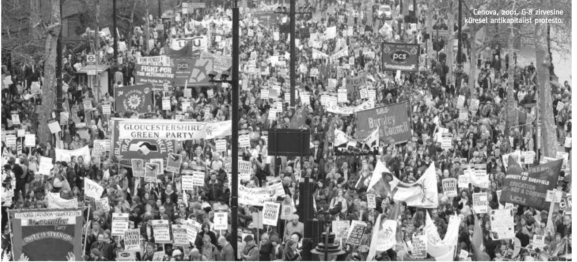
Cenova, 2001. G-8 zirvesine küresel antikapitalist protesto.