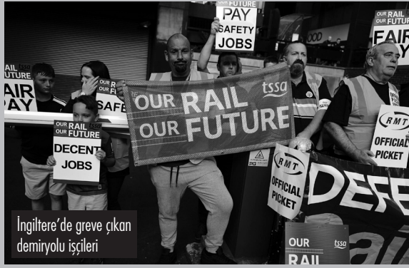
İngiltere'de greve çıkan demiryolu işçileri

2018 seçimlerinden sonra kurulan 5 Yıldız Hareketi'nin güven oylamasındaki olumsuz kararının sebebiyse Roma'da kurulması planlanan 'atıktan enerji üretimi' tesisinin çevre kriterlerine uygun görülmemiş olmasıydı.