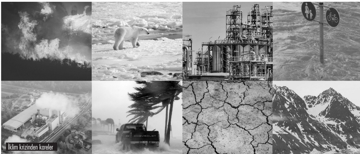
İklim krizinden kareler

Bir başka deyişle; kapitalizmden kurtulmanın zamanı geldi.