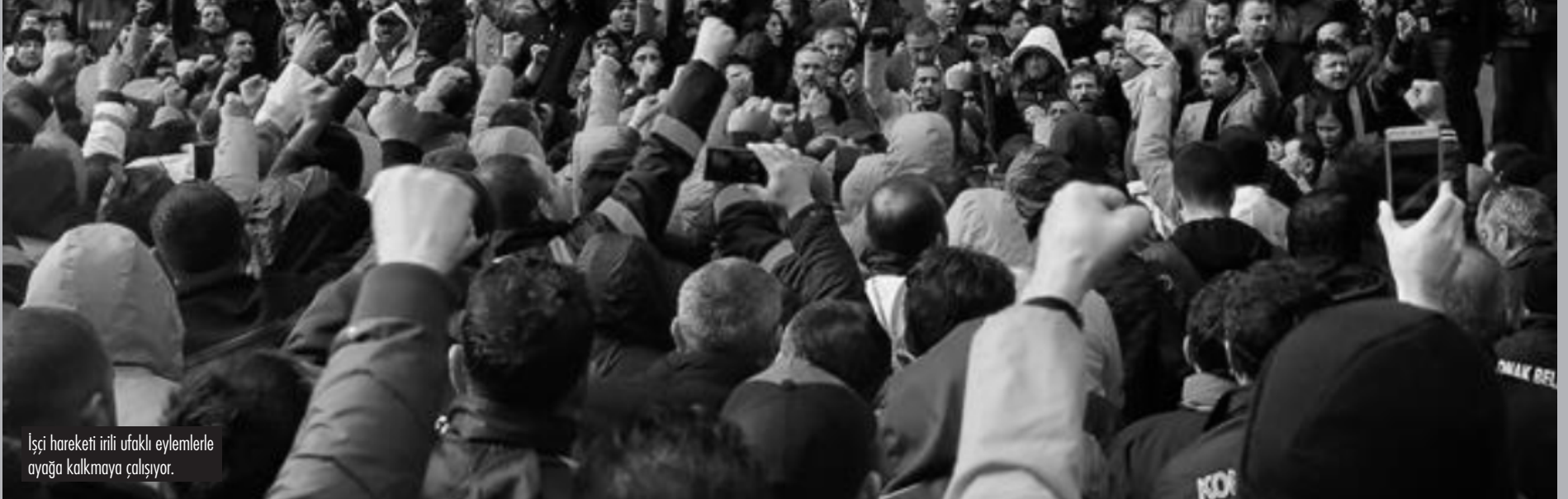
İşçi hareketi irili ufaklı eylemlerle ayağa kalkmaya çalışıyor.

Dünyada otoriter rejimler daha sağların-daki faşist güçler tarafından baskı altına alınırken, Türkiye’de rejim, hali hazırda faşist bir parti tarafından aktif bir şekilde destekleniyor. Türk usulü başkanlık rejimi, rejimin hiyerarşik yapısı gereği başkanmış gibi davranan asli yöneticinin istifasının mümkün olmadığı bir teknik koşul yaratıyor. Bu yapı dışındaki her durumda, Türkiye’de tüm alanlar mevcut yöneticilerin topyekûn istifasının kaçınılmaz olduğu bir keşmekeş içerisinde.