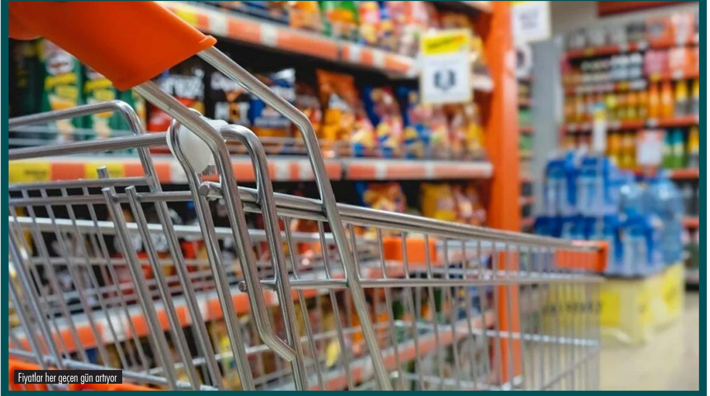
Fiyatlar her geçen gün artıyor

Türkiye'de çok yoğun bir yoksuldan zengine kaynak transferi dönemi yaşıyoruz. Bunu iktidar enflasyon sayesinde gerçekleştiriyor. Enflasyonla yoksulların her türlü harcamaları üçe dörde, beşe katlanırken, gelirler ortalama yüzde 50-60 artıyor. Bu da