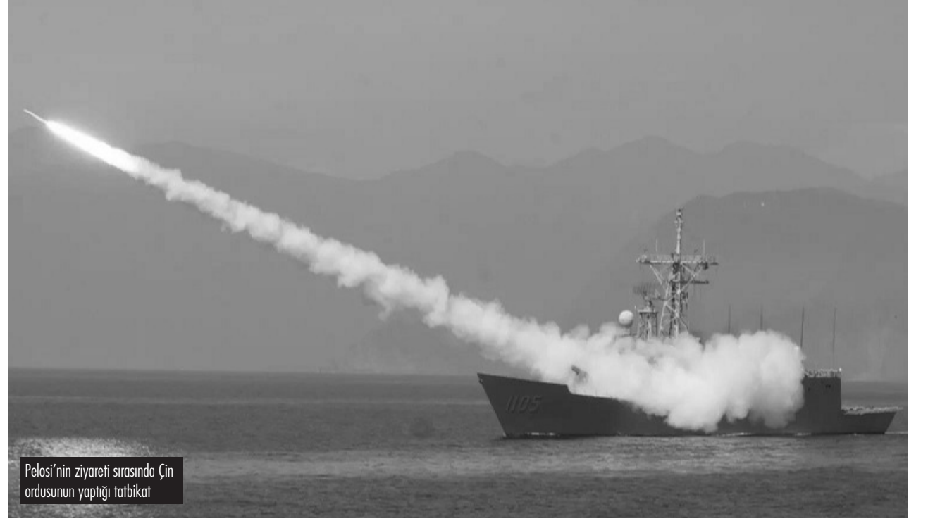
Pelosi'nin ziyareti sırasında Çin ordusunun yaptığı tatbikat

Dünyanın en büyük iki ekonomisini barındıran ve en fazla askeri harcamayı yapan emperyalist devletler olan ABD ve Çin arasındaki rekabet Tayvan üzerinde yoğunlaşıyor.