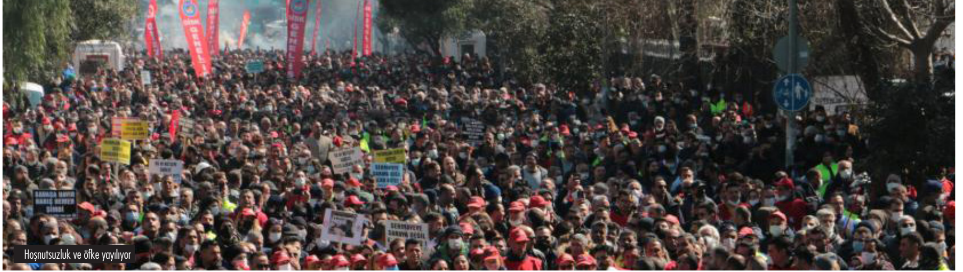
Hoşnutsuzluk ve öfke yayılıyor

Birkaç sene önce her birimizin oluk oluk kanını akıtacağını söyleyen Sedat Peker yeni bir ifşa zinciriyle bu sefer iktidarın merkezlerine saldırdı. Çok açık ki Peker'e devletin çeşitli yerlerinden sistematik bir şekilde bilgi belge ulaşıyor ve bu organize suç örgütü lideri de iktidarla pazarlık yapıyor. Evine el konulmasıyla Peker'in el yükseltmesi bir oldu.