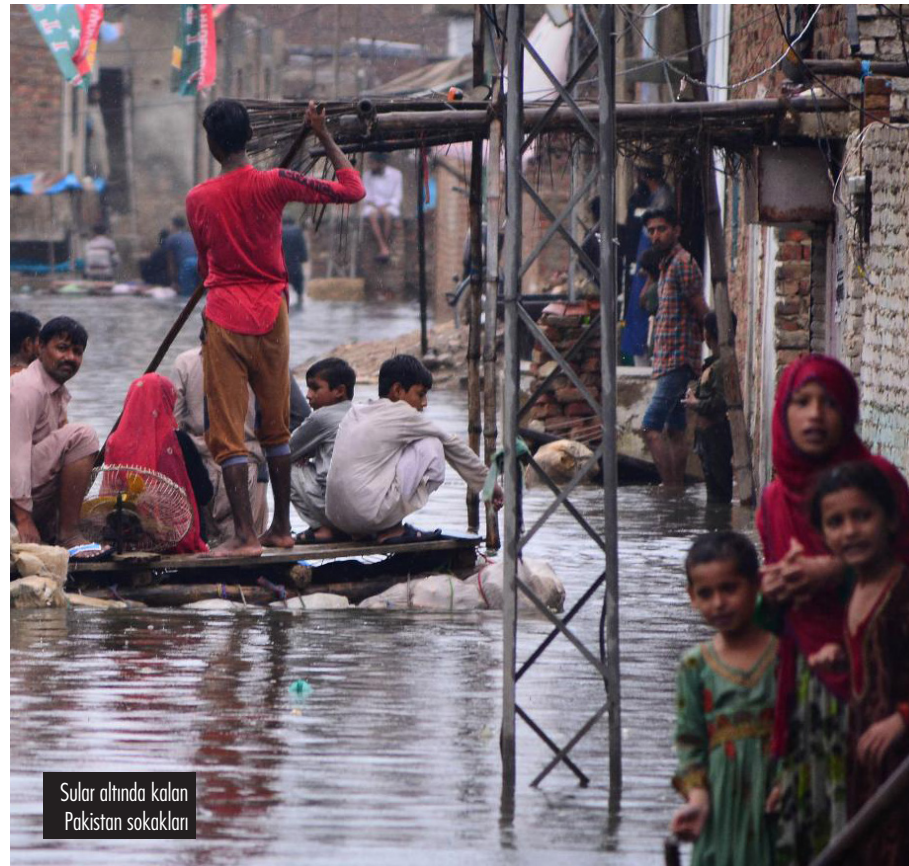
Sular altında kalan Pakistan sokakları

Kimi iklim raporlarında senelerdir değişilmekte olan bir gerçek var: Bu varoluş