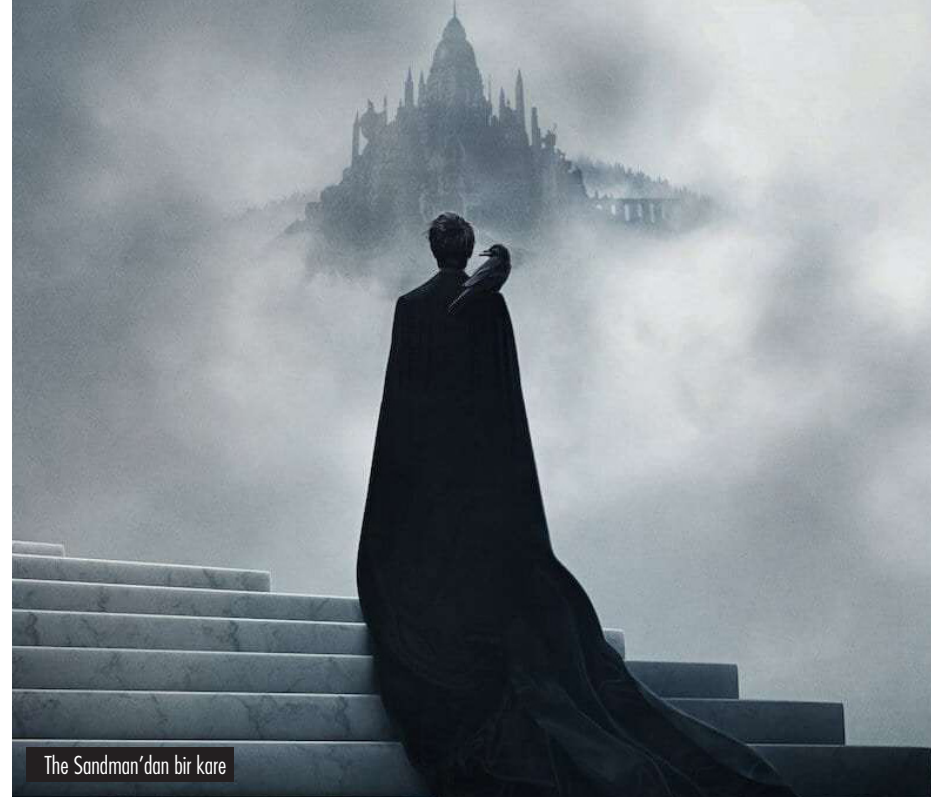
The Sandman'dan bir kare

Felsefe ve mitoloji tutkunlarının ekran karşısına kağıt ve kalemlerini de alarak oturmayı tercih edebilecekleri, bolca not almak isteyebilecekleriniz, sizi içine çeken ve orada bir keşif yolculuğuna çıkararak bu diziyi başından sonuna kadar aynı