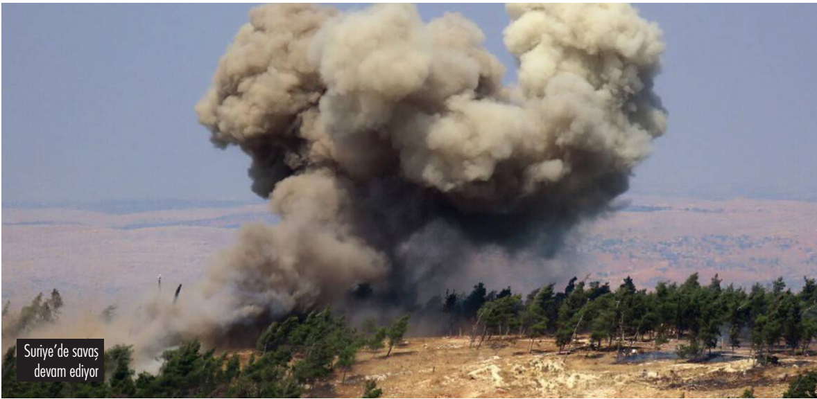
Suriye'de savaş devam ediyor

Geçtiğimiz haftalarda Suriye'nin kuzeyinde önemli şeyler oldu.