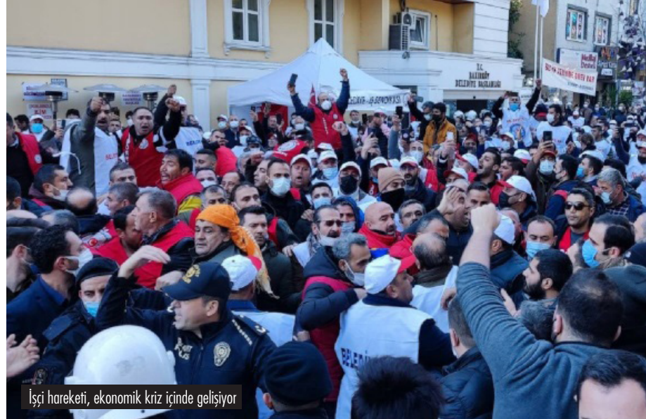
İşçi hareketi, ekonomik kriz içinde geliyor

Hareketlerin büyüdüğü ve kritik bir viraj alması gerektiği anlarda hareket içindeki tartışmalar da keskinleşir. Yakın zamanda gerçekleşen iki büyük hareketten örnek verilebilir. Birisi gezi direnişi. Gezi direnişi içerisinde diğerleri üzerinde fikri hegemonyasını sağlayabilecek, emek örgütlerini harekete geçirebilecek bir devrimci parti olsaydı, direnişin kaderi daha değişik olabilirdi. Liderliğinde hiçbir milliyetçi öğeyi barındırmayan, bu güçlerin hareketi belirlemesine izin vermeyecek kadar aktif ve büyük bir örgüt, Gezi direnişinin emek örgütlerinin işyeri temelli direnişiyle bütünleşmesi için tartışabilirdi. Uzun süre devam eden mahalle forumlarına daha kalıcı müdahalelerde bulunabilirdi.