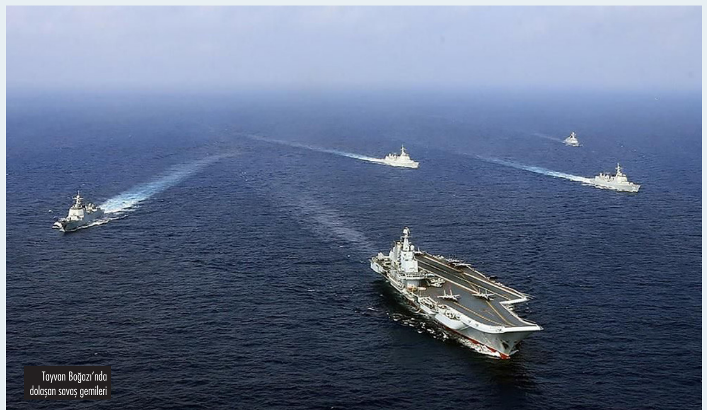
Tayvan Boğazı'nda dolaşan savaş gemileri

Bu bağlamda, Tayvan'ın bir ulus-devlet olarak kaderini, bu ülkenin işçi sınıfı ve marjinalleştirilmiş azınlıkların kendi kaderlerini tayin hakkından ayırmak mümkün görünmüyor.