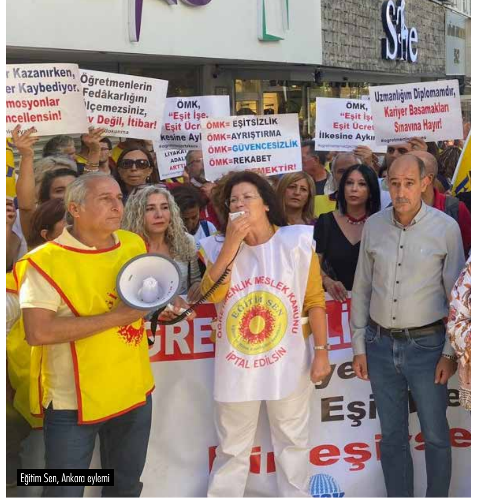
Eğitim Sen, Ankara eylemi

Yereldeki eylemlere fabrika işçilerinden, emeklilere kadar birçok iş kolundan destekler de geliyor. Çünkü tekstil işçisiyle, öğretmenin, emekli ile seramik işçisinin çıkarları aynı. Bu birleşik hatları oluşturmak yerine üyelerine Eğitim Sen eylemlerine katılmayın, destek vermeyin çağrısı yapan sendika bürokratlarını da alaşağı edecek