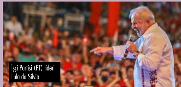
İşçi Partisi (PT) lideri Lula da Silva

otoriter ve aşırı sağcılar gibi seçim stratejisinin içine seçimler hakkında şüphe yaratma ögesini de ekliyor. Seçimlere küresel bir komployla müdahale edileceği ve hile karıştırılacağı Bolsonaro'nun iddiaları arasında.