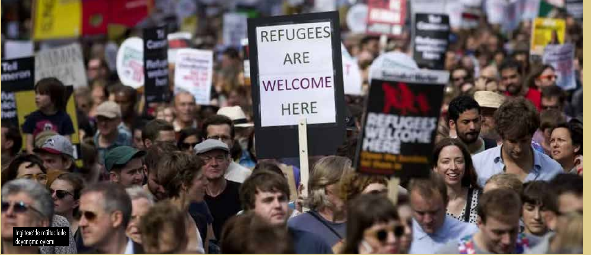
İngiltere'de mültecilerle dayanışma eylemi