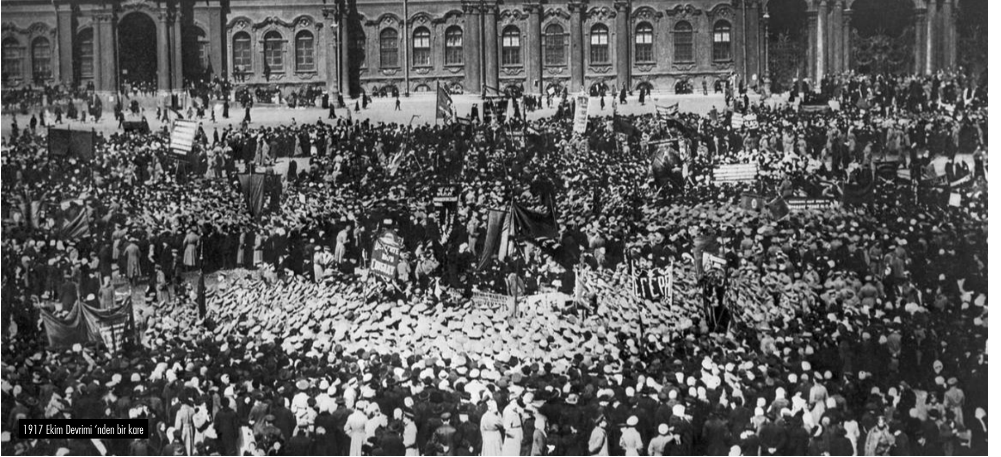
1917 Ekim Devrimi'nden bir kare