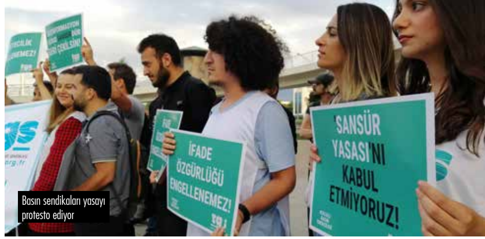
Basın sendikaları yasayı protesto ediyor

Türkiye’de hâlihazırda geleneksel mecralarda faaliyet gösteren basın emekçileri, örneğin muhalif gazeteler Basın İlan Kuru-