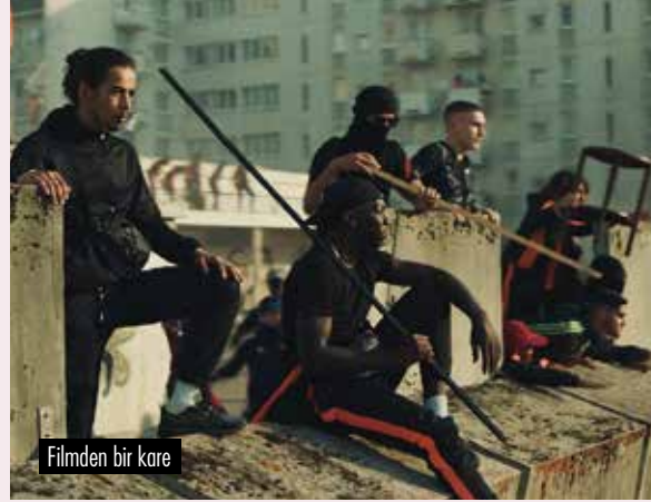
Filminden bir kare

Protestocular tarafından rehin alınan polis memuru Jérôme'dan Karim'in madalyalı bir ordu gazisi olduğunu anladığımız ağabeyi Abdel'e kadar herkesin anlatacak bir hikayesi olsa da bunu yapacak zamanı bulabilmeleri mümkün değil. Gavras, kendisine meydan okuyan en büyük zorluğu tam olarak bu olduğunu söylüyor ve bir röportajında "Karakterlerini, benim açıklamama gerek kalmadan somutlaştırmayı başarsınlar istedim" diyordu. Tıpkı kendisini öyle bir kaosun kalbinde bulacak birinin, yaşananları biraz daha mantıksal bir çerçeveden değerlendirecek kadar durup düşünmeye vakit bulamayacak olması gibi, oyuncuların da üstlendikleri karakterleri ekrana nasıl yansıtacakları üzerine düşünmeye fırsat bulamadıkları çok açık. Herkesin bir şeye doğru koştuğu ya da ondan kaçtığı bir filmde, bir