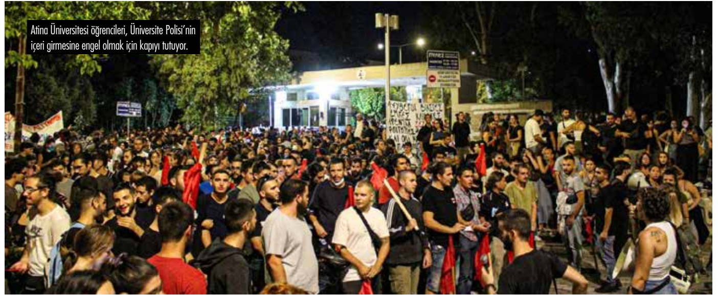
Atina Üniversitesi öğrencileri, Üniversite Polisi'nin içeri girmesine engel olmak için kapıyı tutuyor.

Bu yasak, öğrenci hareketinin, diktatörlüğün 70'lerdeki çöküşünden bu yana gerçekleşmiş başlıca kazanımlarından biri olarak görülüyordu. O zamandan bugüne ve bunu takip eden on yıllar boyunca,