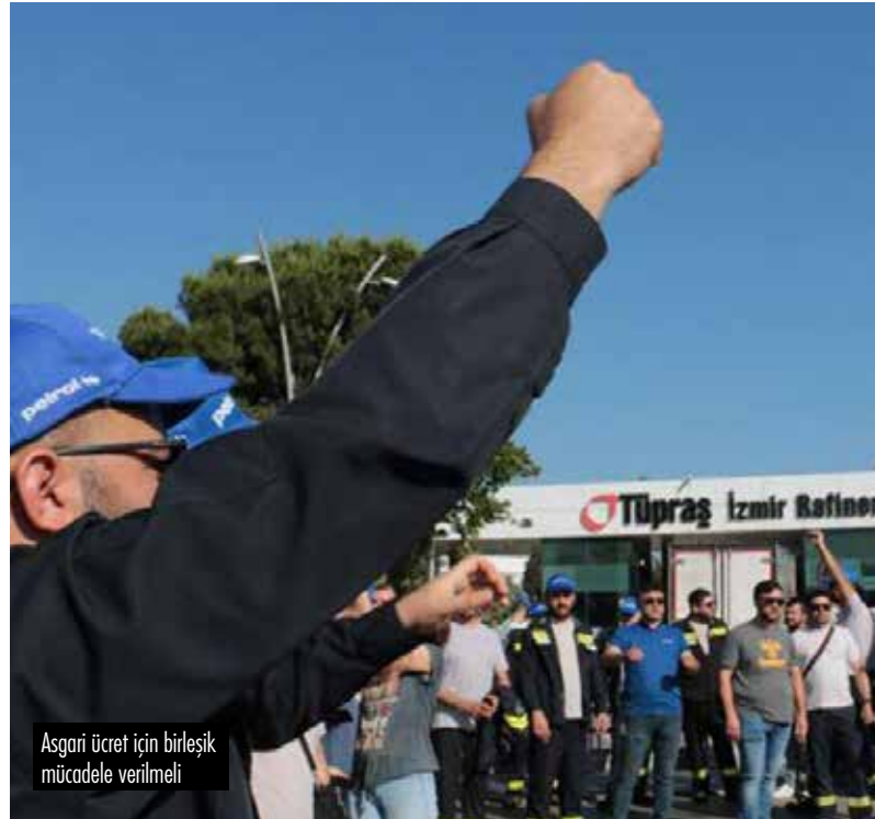
Asgari ücret için birleşik mücadele verilmeli

Bu kışı atlatmak için emek örgütleri derhal bu talepler için harekete geçmelidir.