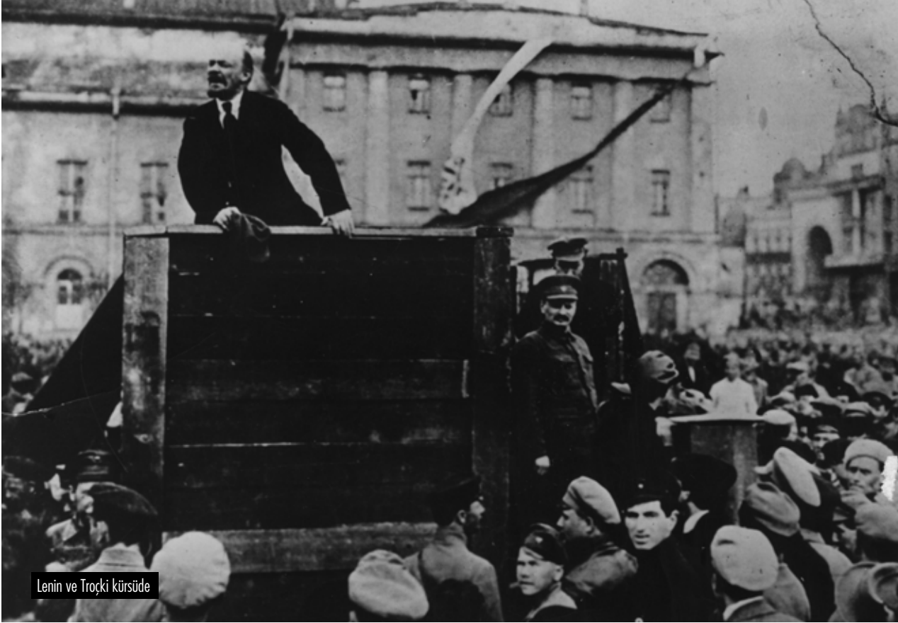
Lenin ve Troçki kürsüde