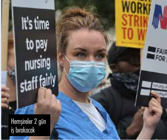
Hemşireler 2 gün iş bırakacak

İngiltere'de pek çok sektörden işçi, ülkede yükselen enflasyona ve hayat pahalılığındaki artışa karşı greve çıktı. Kış aylarında enerji fiyatlarındaki artış ve gıda ürünlerindeki enflasyon, İngiltere halkının maaşlarının giderek daha büyük bir bölümünü temel harcamalarına ayırmasına neden oluyor. Yapılan bir araştırmaya göre ülkede dört milyon aile, Nisan ayına kadar gelirlerinin üçte birini sadece enerji masraflarını karşılayabilmek için ayırmak zorunda kalacak. Hem kamu sektöründeki hem de özel sektördeki işçiler bu duruma gösteriler ve grevlerle direniyor. Posta çalışanları, üniversite çalışanları ve işçiler, tren makinistleri, hemşireler, öğretmenler ve liman işçileri son dönemde greve gittiler. Sendika üyesi 115.000 işçinin işvereni olan Posta Servisi, greve çıkan işçilerin gözünü korkutmak için sendika temsilcilerine uzaklaştırma cezaları veriyor ve işlerini geçici olarak askıya alıyor, ülke çapında 59 sendika üyesinin işi bu şekilde askıya alınmış durumda. Posta Servisi idaresi enflasyonun %11 olduğu ülkede maaşlara %7 zam ve %2'lik tek seferlik ödeme teklif ediyor ve eğer bu teklif kabul edilmezse 10.000 kişiyi işten çıkarmakla tehdit ediyor.