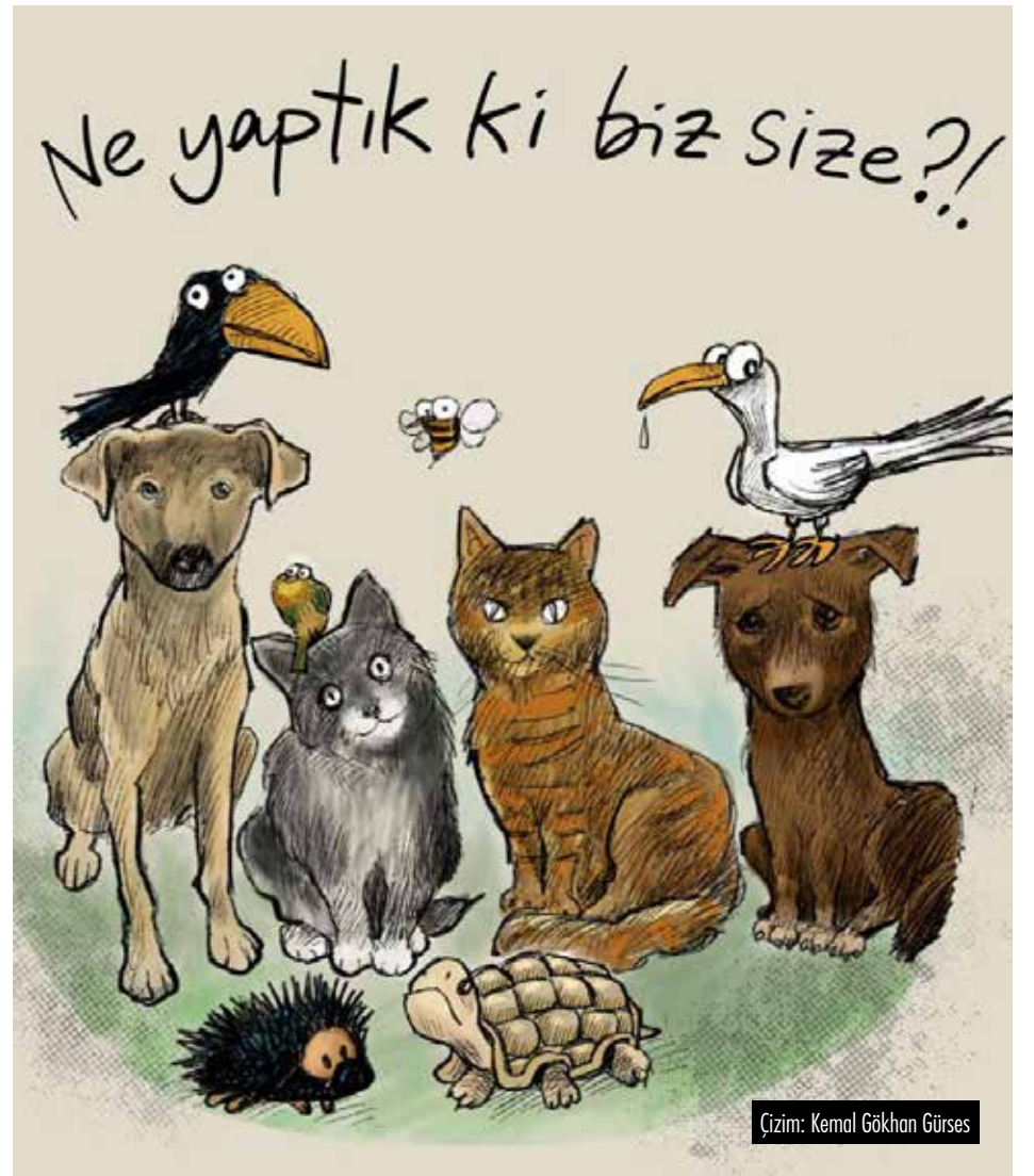
Çizim: Kemal Gökhan Gürses

■ Sokakta yaşayan hayvanlar, sokak sakinleridir. Yaşadıkları yerlerde karşılaştıkları tüm sorunlar ortak yaşam kültürüne bağlı kalınarak çözülmeli, yaşam haklarına yö-