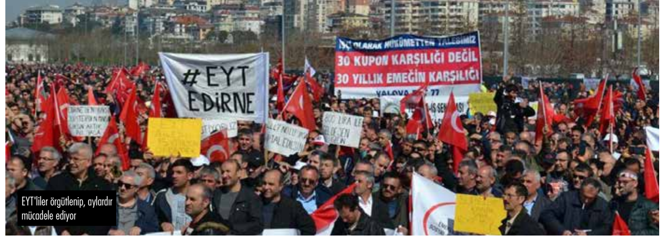
EYT'iler örgütlenip, aylardır mücadele ediyor

Emeklilikte yaşa takılanlar (EYT) için yapılan çalışmalarda sona yaklaşıyor. Seçimlere 6 ay kala AKP-MHP koalisyonu kapsamı henüz belli olmasa da bir EYT yasası çıkarmayı planlıyor.