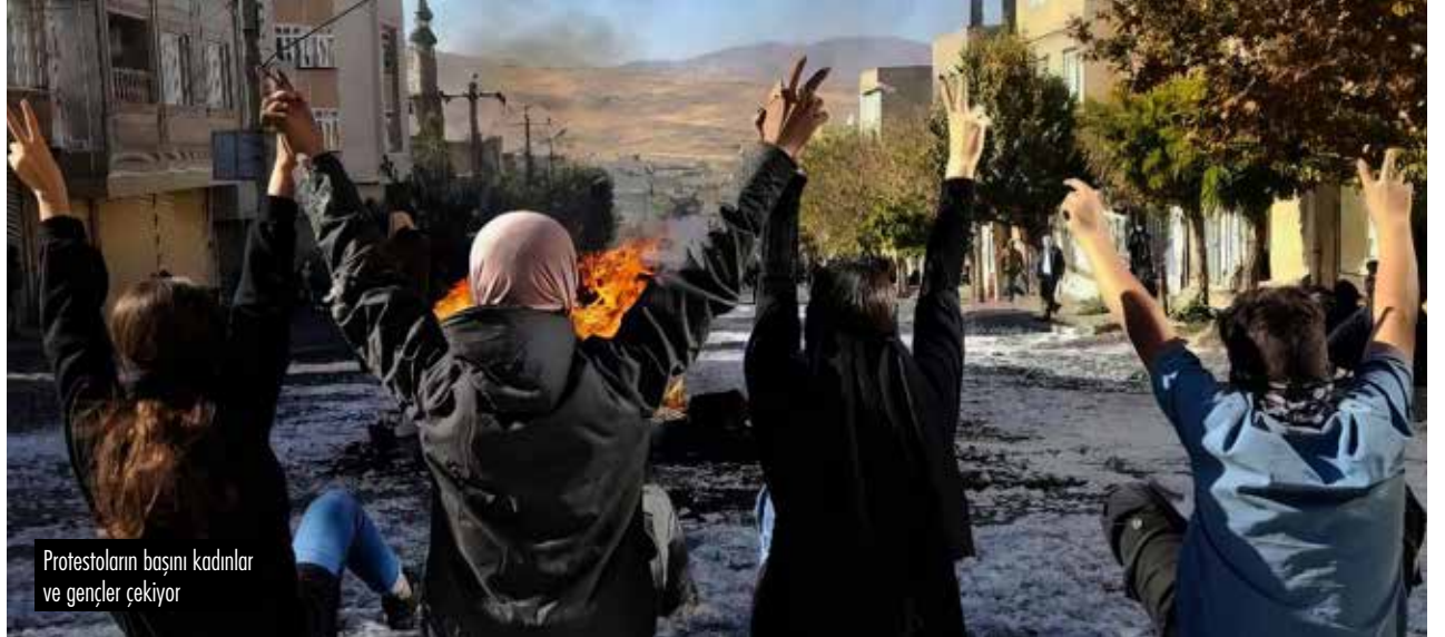
Protestoların başını kadınlar ve gençler çekiyor