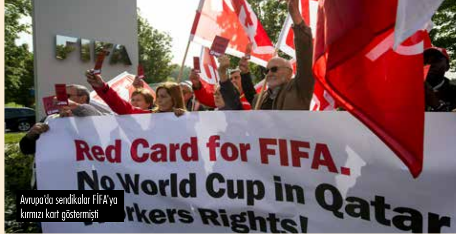
Avrupa'da sendikalar FIFA'ya kırmızı kart göstermişti

Bu kararlar ilgili İsviçre, ABD gibi diğer aday olan ülkelere sayısız soruşturma yürütüldü ve %100 kanıt sayılacak bir şey çıkmaya da şüpheli durum bugüne kadar devam etti.