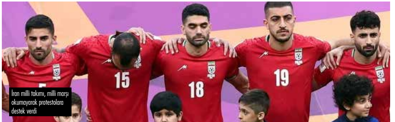
İran milli takımı, milli marşı okumayarak protestolara destek verdi

Rejimin dini otoritesi Ayetullah Ali Hamaney 26 Kasım'da rejimin paramiliter güçlerinden olan Besiç mensuplarıyla bir araya gelerek, göstericileri "isyancılar" olarak nitelendirdi ve onlara "cahil" ve "paralı asker" dedi. Dünyanın farklı ülkelerinde yaşayan İranlıların eylemleri de sürüyor, son olarak Türkiye'de yaşayan İranlılar 27 Kasım'da İzmir'de bir eylem düzenleyerek "İran'da yaşanan ölüm ve dehşete son verilmesi için toplandık. Din dil, ırk, mezhep ayrımı olmaksızın laik, demokrat ve özgür yaşamak istiyoruz" dediler.