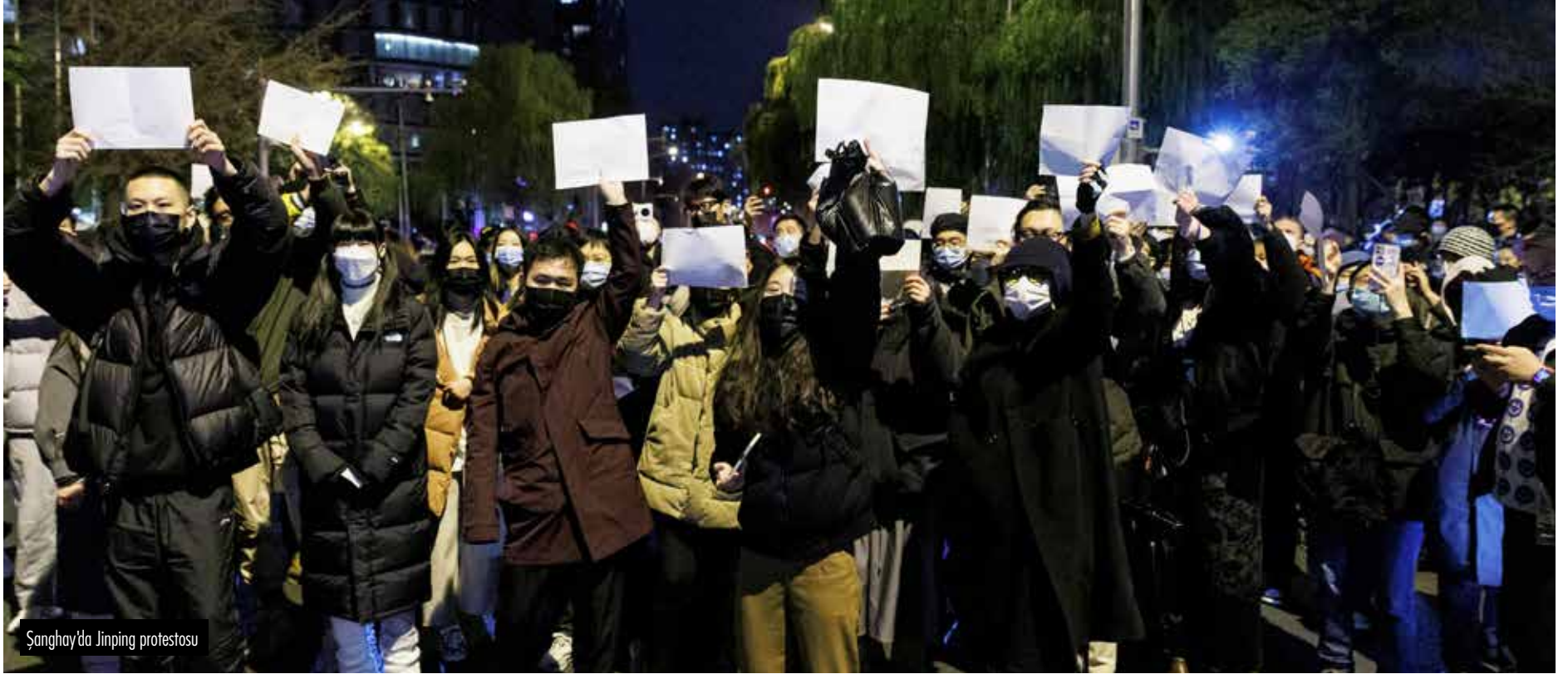
Şanghay'da Jinping protestosu