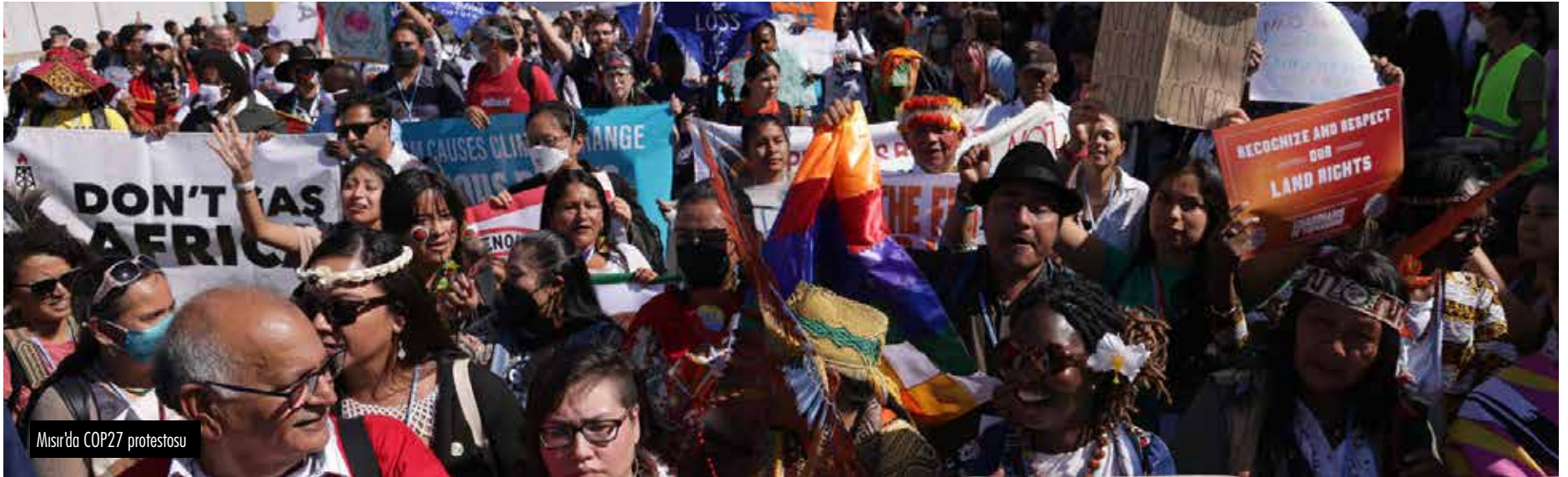
Mısır'da COP27 protestosu