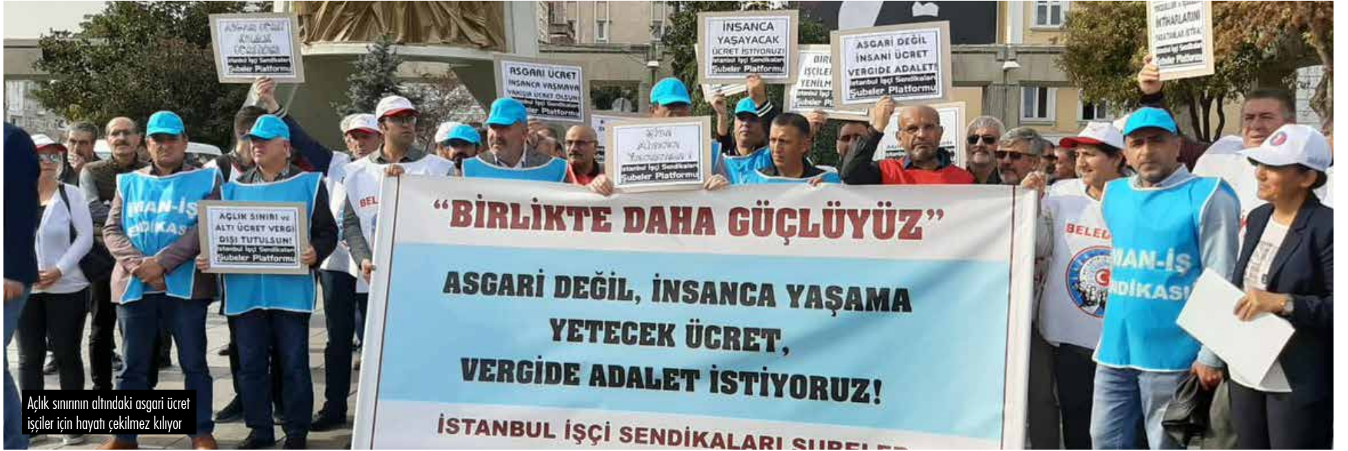
Açlık sınırının altındaki asgari ücret işçiler için hayati çekilmez kılıyor