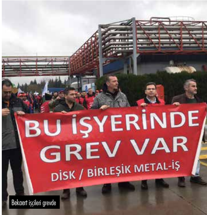
Bekaert işçileri grevde

grev ikinci gününe girmişti. 400 metal işçisi yasağı tanımadı. Grev ilan edilirken konuşan işçiler "Bu grevin sadece Bekaert işçisinin değil tüm işçi sınıfının yasaklara karşı grevi" olduğunu söylediler. "Bekaert işçisi yalnız değildir!" sloganlarıyla başlayan grev sırasında konuşan sendika başkanı Adnan Serdaroğlu, "Burada tarihi bir mücadeleyi başlatıyoruz. Bugün verilen mücadelenin önemi çok daha farklıdır. Aylardır işverene karşı bir hak mücadelesi veriyorduk. Grev başlangıç aşamasına gelirken karşımızda başka birileri daha belirdi."