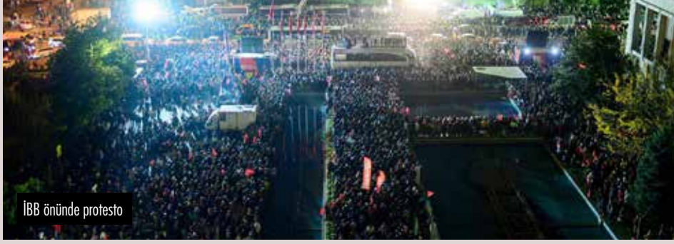
İBB önünde protesto

İstanbul Büyükşehir Belediyesi başkanlığını iki kez kazanan Ekrem İmamoğlu, hakkında açılan garip bir hakaret davası sonucu cezalandırıldı. Siyasi yasaklı haline getirildi.