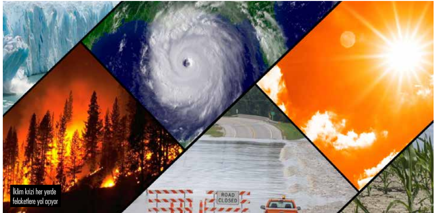
İklim krizi her yerde felakete yol açıyor

İşletme ne kadar yıkıcı olursa, siyasi korumadan yararlanma olasılığı da o oranda artıyor. Bu ay yayınlanan bir araştırmada, Herefordshire ve Shropshire'da inşa edilen tavuk çiftliklerinin, iş imkanı sağladıkları insanlardan çok daha fazlasını işsiz bırakacağı, neden oldukları nehir ve hava kirliliği, koku ve doğal bozulma