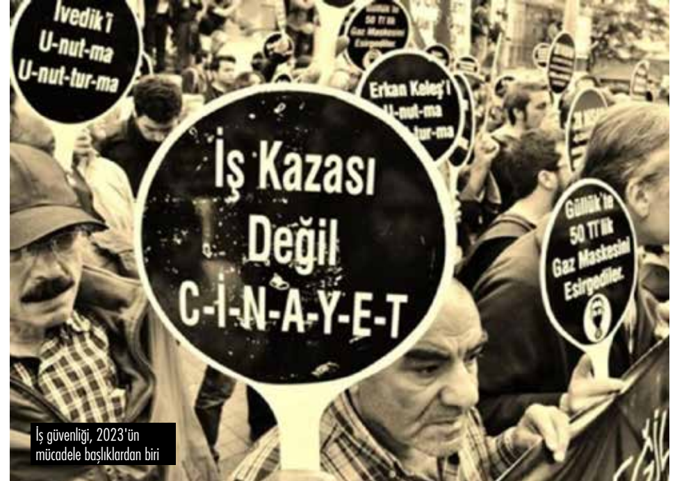
İş güvenliği, 2023'ün mücadelesi başlıklarından biri

İşçi Sağlığı ve İş Güvenliği (İSİG) Meclisi 2022 yılına ait iş cinayetleri raporunu yayımladı. 2022 yılında bin 843 işçi yaşamını yitirdi.