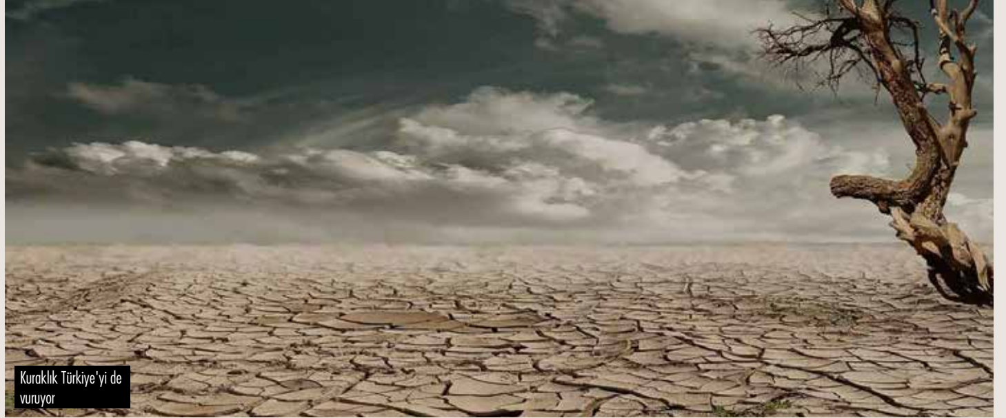
Kuraklık Türkiye’yi de vuruyor