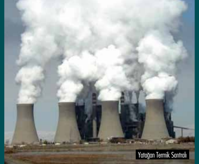
Yatağan Termik Santrali

Küresel ısınmaya yol açan sera gazlarıyla atmosferi kirleten sera gazı salımlarının en büyük sorumlusunun ABD ve Çin olduğu biliniyor. Bunları Rusya, Brezilya ve Endonezya izliyor.