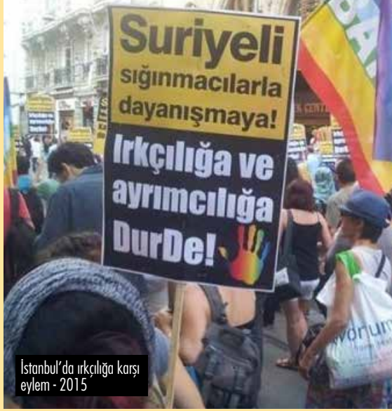
İstanbul'da ırkçılığa karşı eylem - 2015

Seçimlerin ardından ırkçı Fatih Altaylı gibi isimlerin tetiklemeyle göçmenleri suçlayan ağır bir saldırı başladı. Kendi milliyetçiliklerinin seçim yenilgisindeki payını görmezden gelen ırkçılar, suçu Suriyeli göçmenlere, göçmenlerin oy vermesine ve oy veren her göçmenin Erdoğan'a verdiği yalanına attılar.