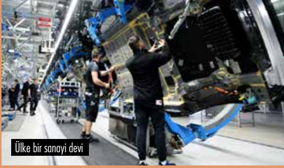
Ülke bir sanayi devi

Avrupa kapitalizminin kalbi olan Almanya beklenmedik bir şekilde resesyona girdi. Yüksek enflasyon nedeniyle tüketicilerin satın alma gücünün azalması durgunluğun başlıca nedeni.