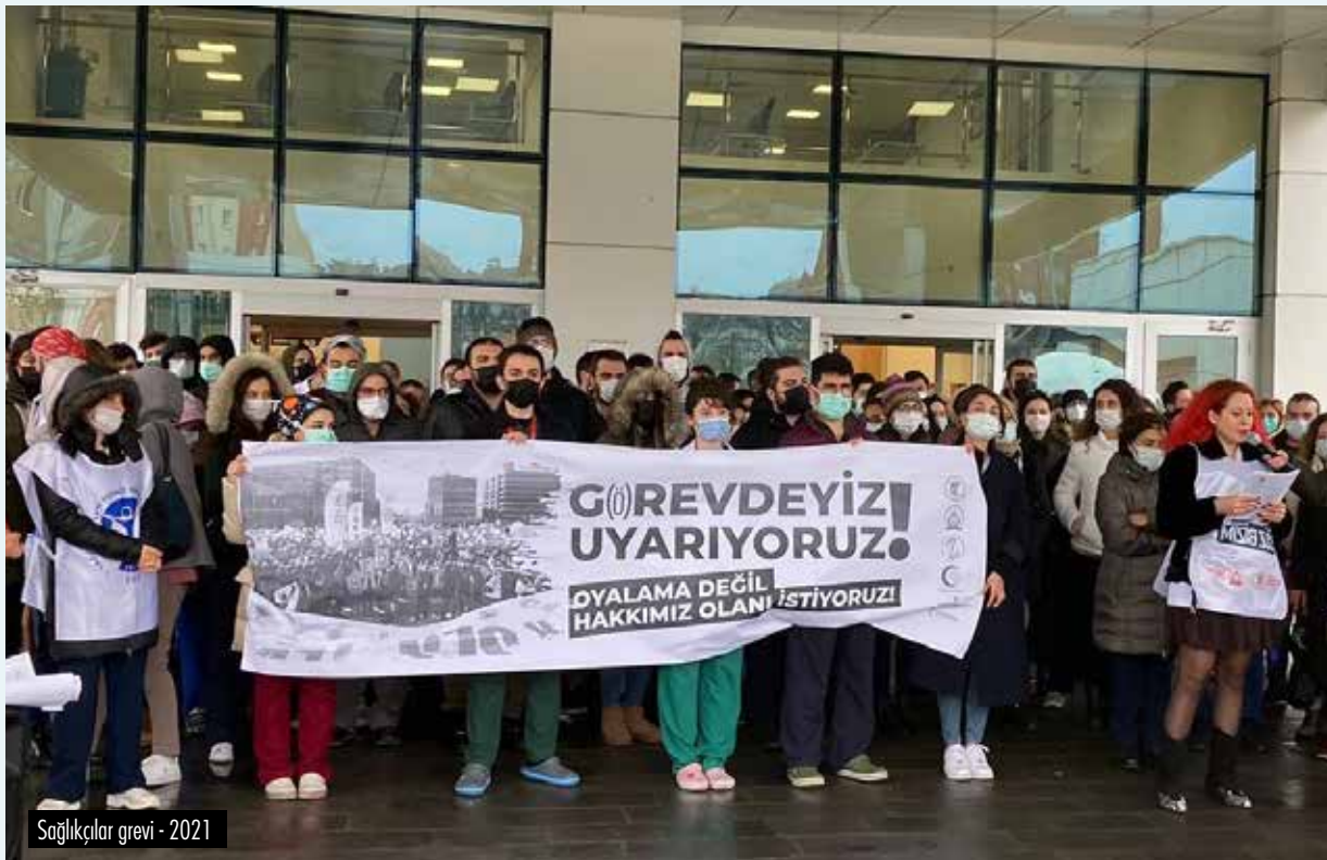
Sağlıklar grevi - 2021

AKP'yi yenmek bu mücadelenin seçimden önce de ilk hedefiydi bugün de ilk hedefi.