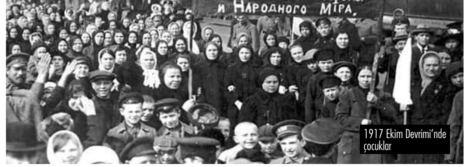
1917 Ekim Devrimi'nde çocuklar

Ciddi zorluklar da yok değildi. Kollontai, devrimden birkaç gün sonra, hem zorlu koşulların yarattığı çaresizlikten hem de elde ettiklerinin verdiği özgüvenden beslenen bir işçi sınıfıyla mücadele ediyordu. Yetimhane çalışanları bebekleri beslemedikleri takdirde kaçırmakla tehdit ederken, bakımevi sakinleri de taleplerini kabul ettirmek için işçi konseyleri örgütlemekle meşguldü.