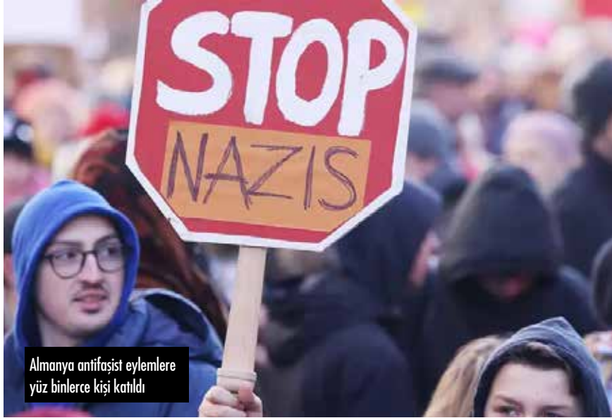
Almanya antifaşist eylemlere yüz binlerce kişi katıldı

Türkiye gayri resmi olarak yüzde 97'si kentlerde yaşayan 6 milyon göçmen ve mültecinin kentlerde küçük ölçekli işletmelerde kayıt dışı çalışıp, ortalamanın üzerinde kira ödeyip, asgari ücretin çok daha altında kazanarak hayatta kalmaya çalıştıkları bir hapishane. Kaçmaya çalışan mültecilerin Çanakkale açıklarında plastik botlarda ya da Türkiye kara sınırında ölümlerle cezalandırıldığı bir açık hava hapishanesi. Her se-