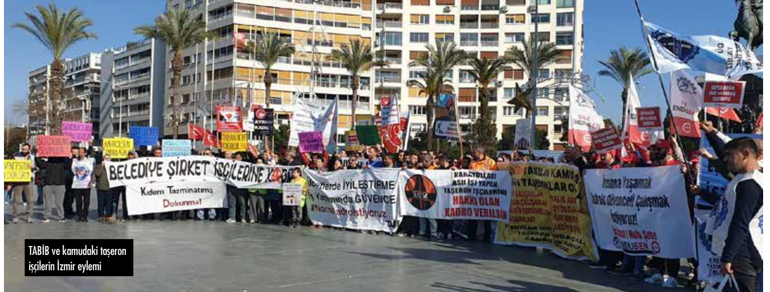
TABİB ve kamudaki taşeron işçilerin İzmir eylemi

Geriye 2024 Toplu İş Sözleşmeleri kalıyor. Onların da belediye başkanlarının, işveren sendikaları ve işçi sendikaları yönetimlerinin el ele vermesiyle işçiye sefalet sözleşmeleri olarak döneceği kesin gibi. Seyyane zamlar ve bir