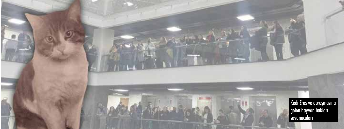
Kedi Eros ve duruşmasına gelen hayvan hakları savunucuları

► İstanbul Başakşehir'de bir sitede doğan ve site sakinleri tarafından 6 yıldır bakılan kedi Eros'u tekmeleyerek öldüren İbrahim Keloğlan serbest bırakıldı. Keloğlan, kediyi ısrarla takip ederek kaçmasını engellemiş ve Eros'u işkenceyle öldürmüştü.