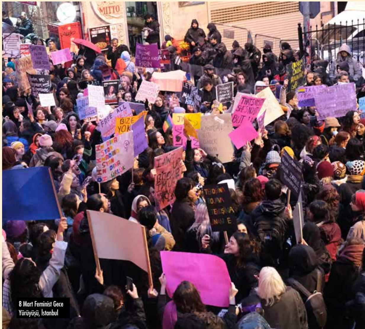
8 Mart Feminist Gece Yürüyüşü, İstanbul

Biz de Antikapitalist Kadınlar olarak kadın hareketinin büyümesini önemsiyoruz. Bu bağlamda mücadelenin birleşik bir şekilde devam etmesi için emek veriyoruz.