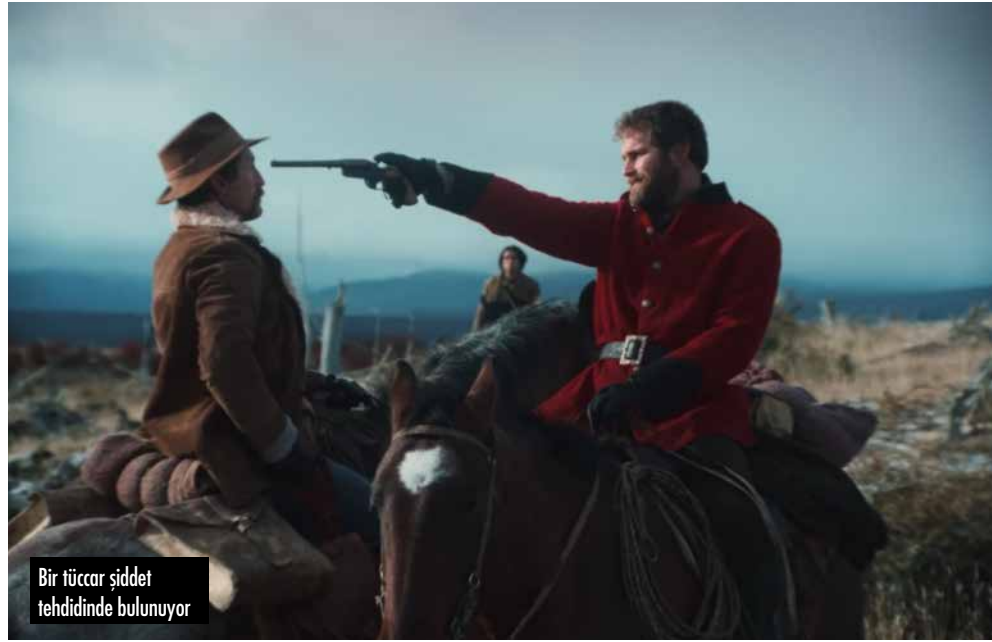
Bir tüccar şiddet tehdidinde bulunuyor