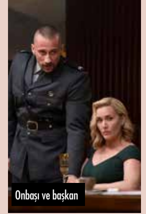
Onbaşı ve başkan

HBO'nun yeni serisi Rejim ; usta oyunculuklar, önemli politik saptamalar, güncel ve tarihsel bir dizi göndermeyle başladı.