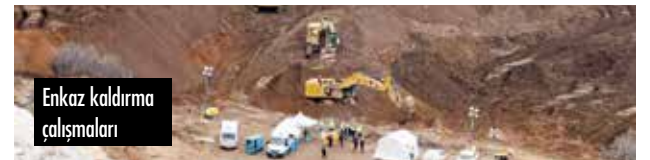
Enkaz kaldırma çalışmaları

Hazırlanan ön bilirkişi raporunda ise yığın lıç sahasının fazlalarının limitleri